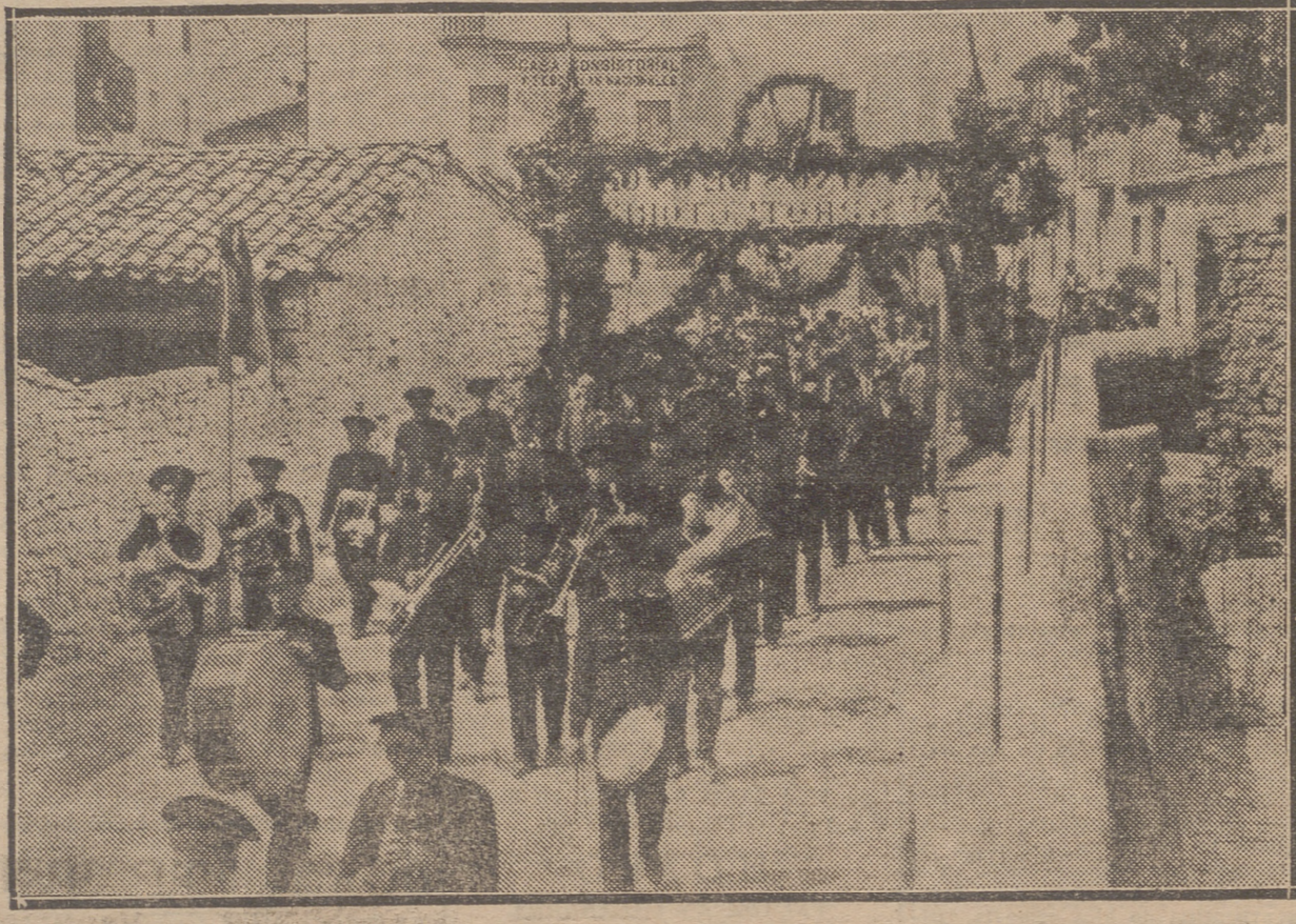
LA COMITIVA A SU ENTRADA BAJO EL ARCO LEVANTADO EN HONOR DE LAS AUTORIDADES.