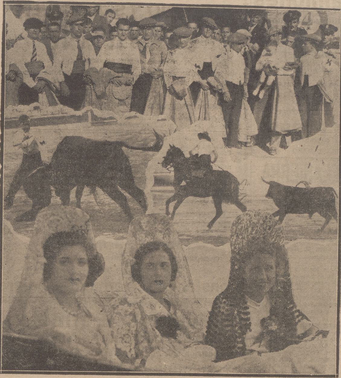
DEL FESTIVAL TAURINO DEL "DIA MUNICIPAL" — LAS BELLISIMAS PRESIDENTAS — LAS CUADRILLAS — DOS MOMENTOS DE LA LIDIA