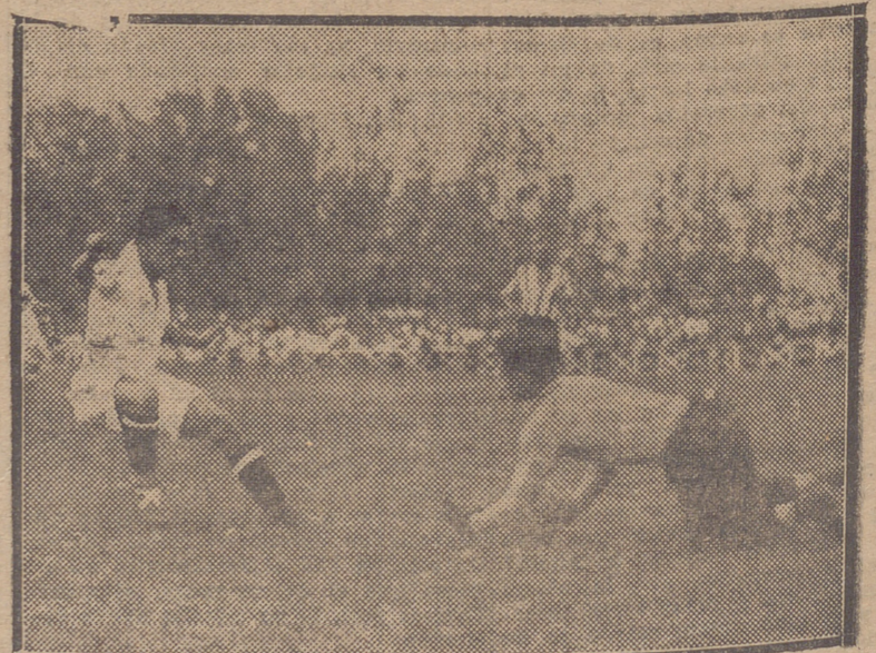
UNA DE LAS MUCHAS FELICES INTERVENCIÓNES DE SANTAMARIA