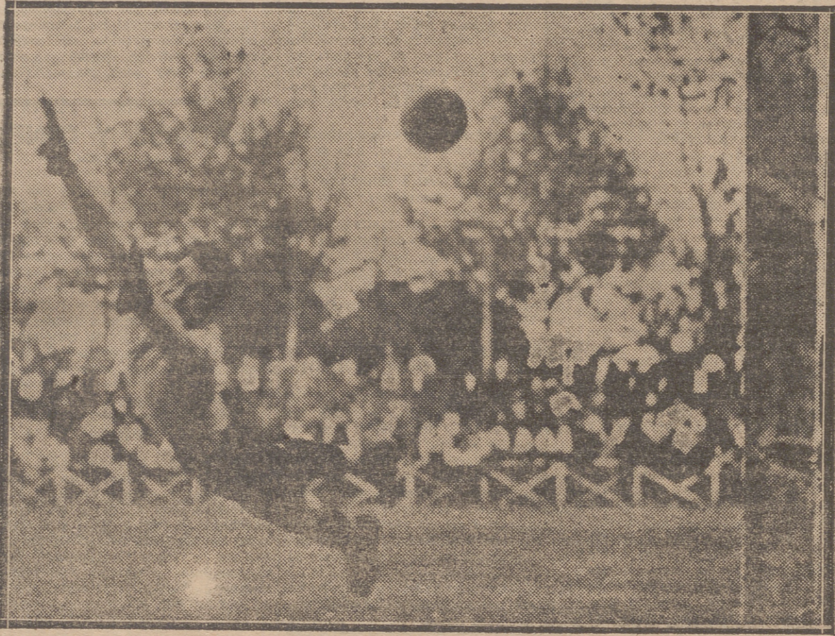
UN GOAL MADRILEÑO QUE NO PUDO EVITAR LA INTERVENCIÓN DEL PORTERO LOGROÑÉS