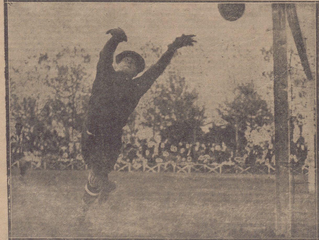
UNA MAGNIFICA Y APURADA ESTIRADA DE ZAMORA SALVANDO EL PELIGRO A CAMBIO DE CORNER

El encuentro fué muy interesante. Empezó carburando y dominando el Athletic, pero faltando a sus ataques profundidad y eficacia. Poco a poco, el Valladolid fué haciendo incursiones a la meta de Guillermo. Se jugaba