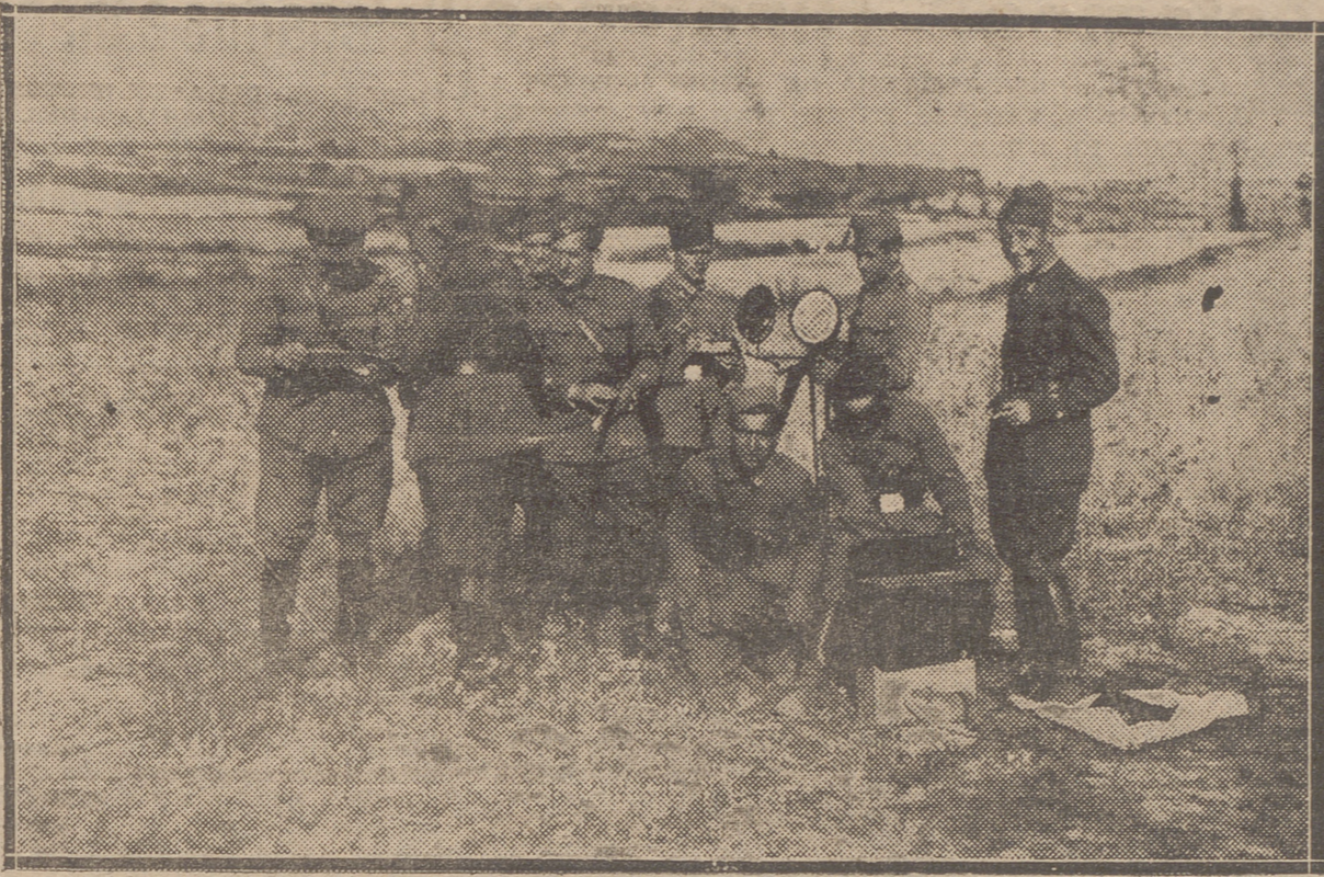
DE LAS ESCUELAS PRACTICAS MILITARES ENTRE HARO Y LABASTIDA.—UN PUESTO DE COMUNICACIONES (RADIO) ESTABLECIDO POR EL REGIMIENTO DE CAZADORES DE CABALLERIA DE GUARNICION EN VITORIA

Armillita, en su primero estuvo muy valiente con el capote y superior con las banderillas. Con la muleta hizo una faena cerca y valiente, adornándose en algunos mulatazos