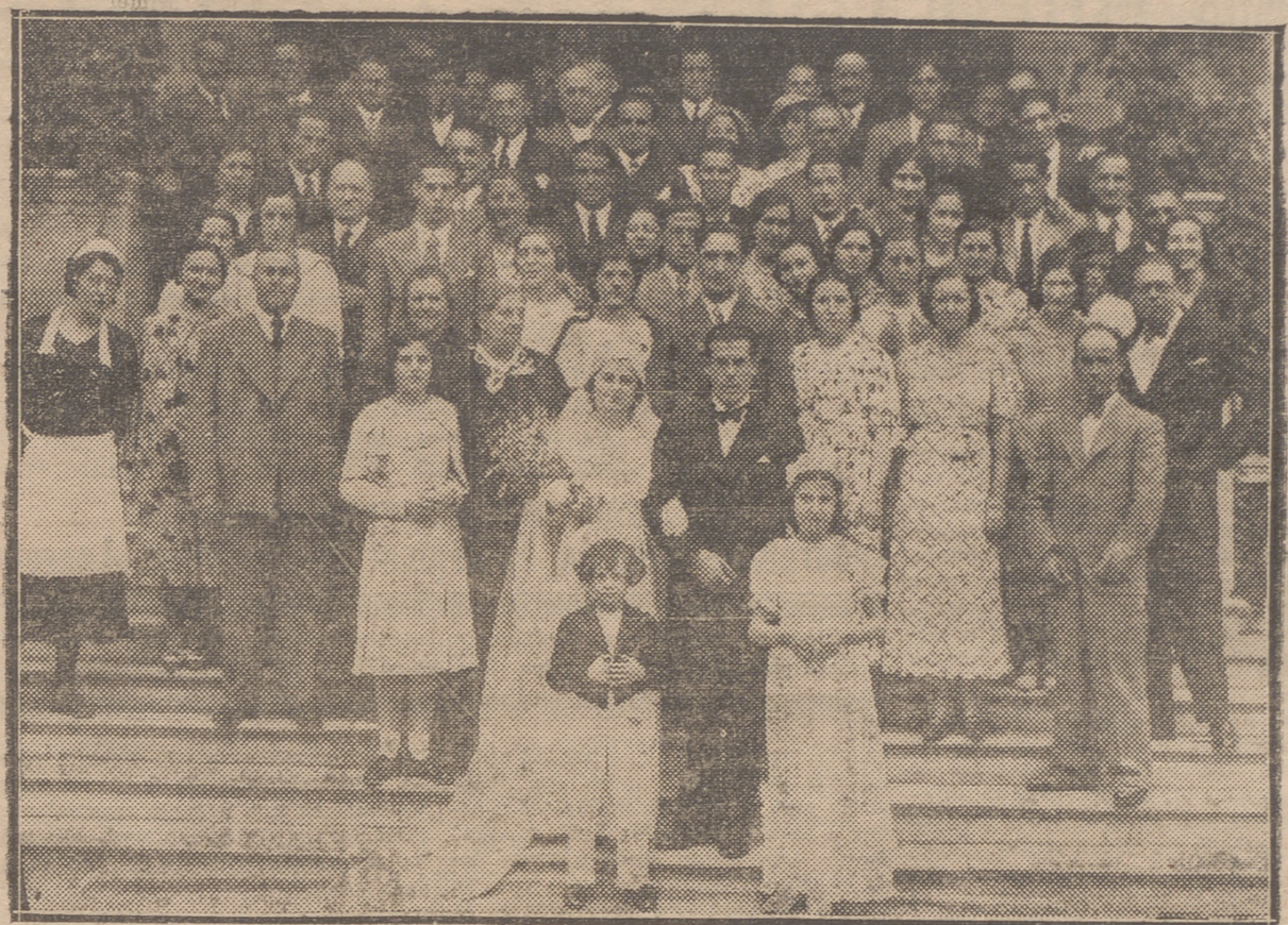
LOS NOVIOS E INVITADOS DE LA BODA DE VIANA, QUE RESEÑAMOS EN CARTA DE DICHA CIUDAD NAVARRA, EN LA ESCALINATA DEL "GRAND HOTEL" DE LOGROÑO.