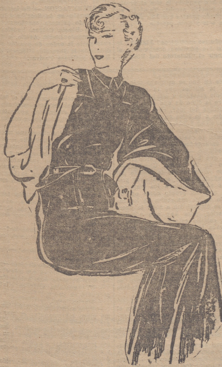
Vestido de lanita negra, con las mangas muy anchas y forradas con lanilla verde.