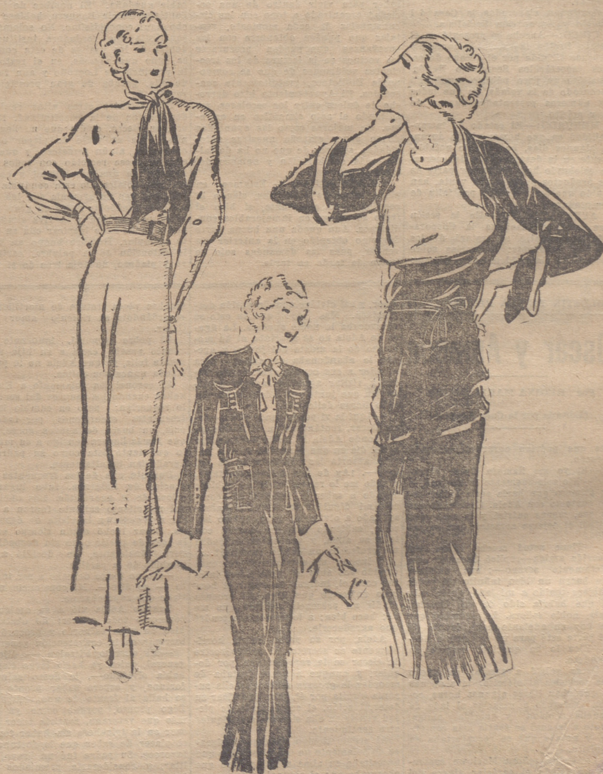
Vestido de djalap, empleado en dos tonos y cortado en bias. — Vestido de lanita negra, adornado con una bata de piqué blanca. — Vestido de crepe "gautre" negro; adornado con el mismo paño blanco.