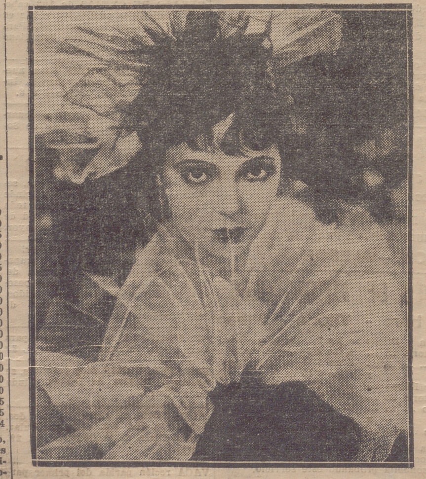
JESSIE MATTHEWS, ESTRELLA INGLESA DE LA GAUMONT-BRITISH