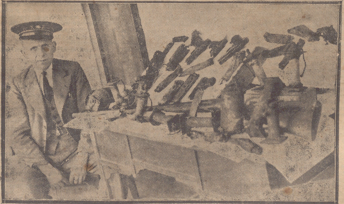
BOMBAS Y ARMAS ENCONTRADAS EN UN MONTE DEL TERMINO DE ABALOS, POR LA GUARDIA CIVIL DE SAN VICENTE DE LA SONSIERRA. (DEL HALLAZGO DABA CUENTA EN EL NUMERO DE AYER NUESTRO CORRESPONSAL DE HARO)

Durante la cena, algunas personas significadas del partido radical noticiosas de la breve estancia del alcalde de Madrid acudieron a saludarle y testimoniarle su simpatía.