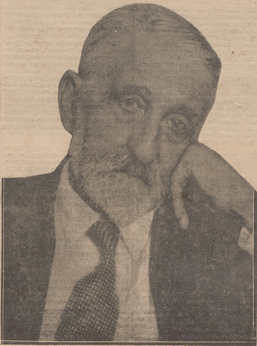
EL ILUSTRE PEDAGOGO RIOJANO D. MANUEL BARTOLOME COSSIO, PRIMER CIUDADANO DE HONOR DE LA REPUBLICA, CUYO CADÁVER FUE AYER INHUMADO EN MADRID

En eso y en muchas cosas, es don Alejandro el mismo Sagasta redivivo.