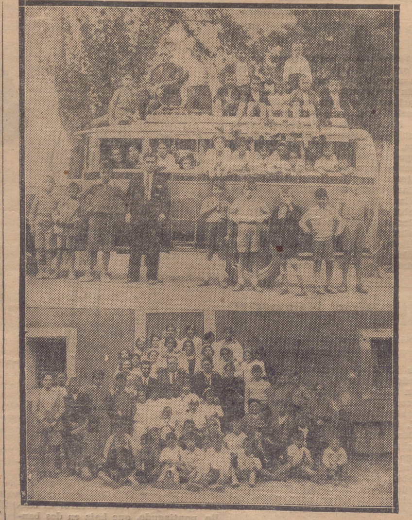
LOS NIÑOS DE LAS ESCUELAS DE SOTO Y TREGUAJANTES QUE VISITARON LOGROÑO