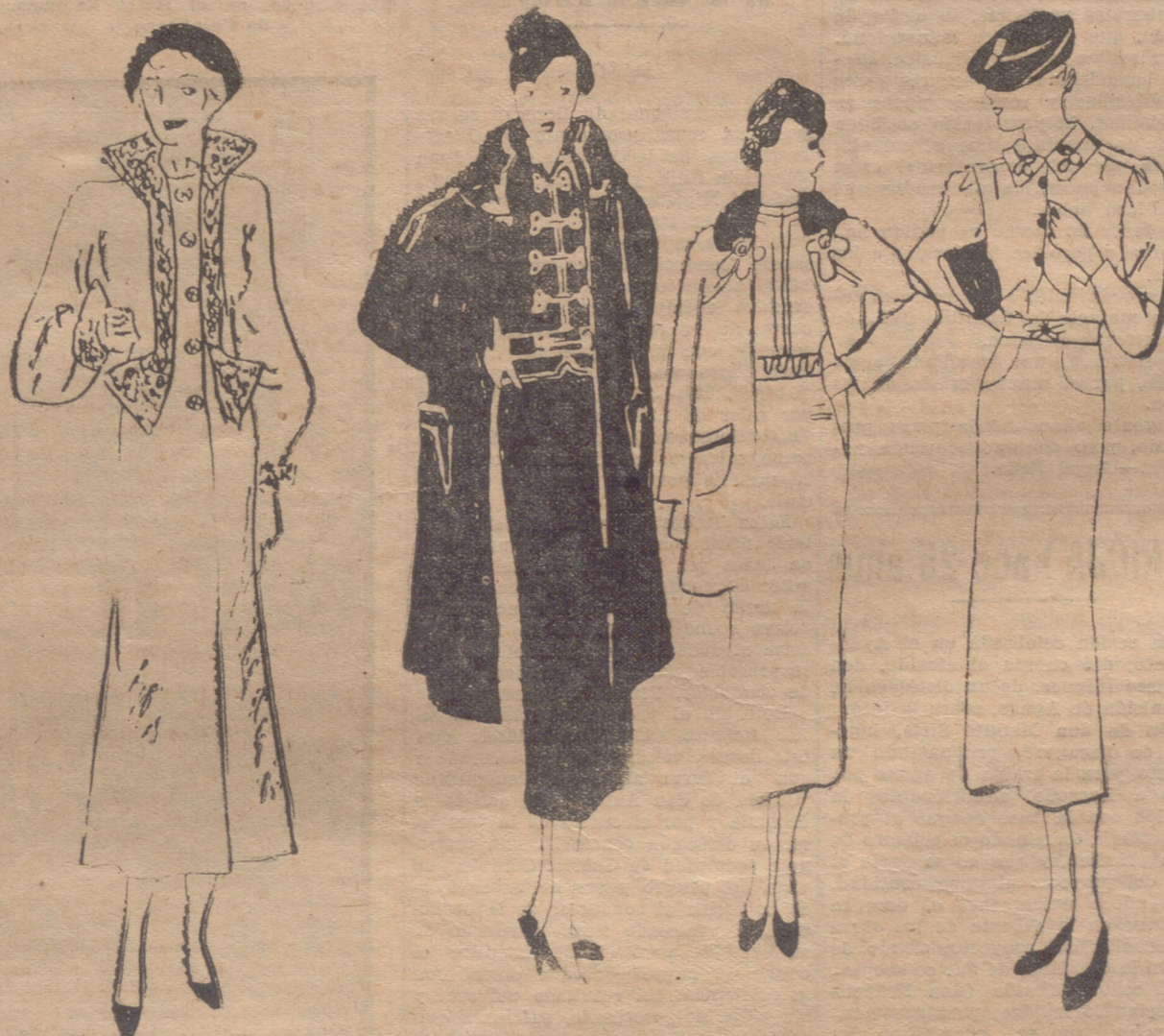
Abrigo de paño verde oscuro. El cuello, puntiagudo, que baja en dos bandas estrechas que se prolongan en la cintura, es de astracán gris claro