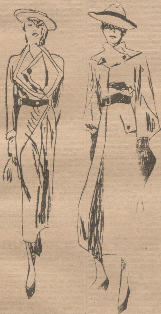
Vestido-abrigo de lana azul marino, el cuerpo, adornado por dos solapas anchas del mismo tejido, que se prolongan hasta el talle. Una tercera solapa de piqué blanco de la misma forma se abotona al costado. Cinturón de charol azul marino con botón blanco. — Abrigo en lana beige, liso o rayado, de marrón. Escote adornado por un amplio cuello, que se cierra con dos botones de madera.