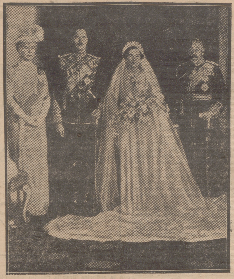
LA BODA DEL TERCER HIJO DE LOS REYES DE INGLATERRA.— EN LA CAPILLA PRIVADA DEL PALACIO REAL, EL PRINCIPE ENRIQUE, DUQUE DE GLOUCESTER, CON LADY ALICE SCOTT, DESPUES DE LA CEREMONIA, CON LOS SOBERANOS DE LA GRAN BRETAÑA.

Terminó diciendo que todos los republicanos deben cumplir con su deber, porque lo importante es modelar el amor al país y esto no se hace sino por el concurso de todos.