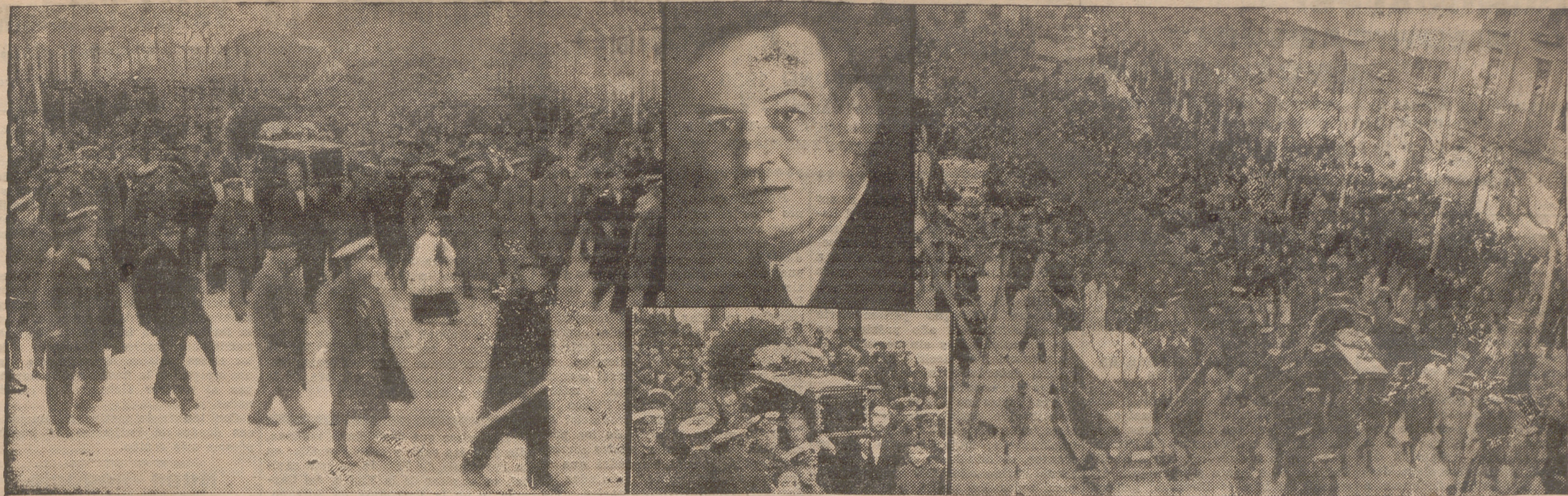
EL ENTIERRO DEL CADAVER DEL DOCTOR CASTROVIEJO. — VARIOS MOMENTOS DEL ACTO FUNEBRE. — EN SILUETA, EL RETRATO DEL FINADO.