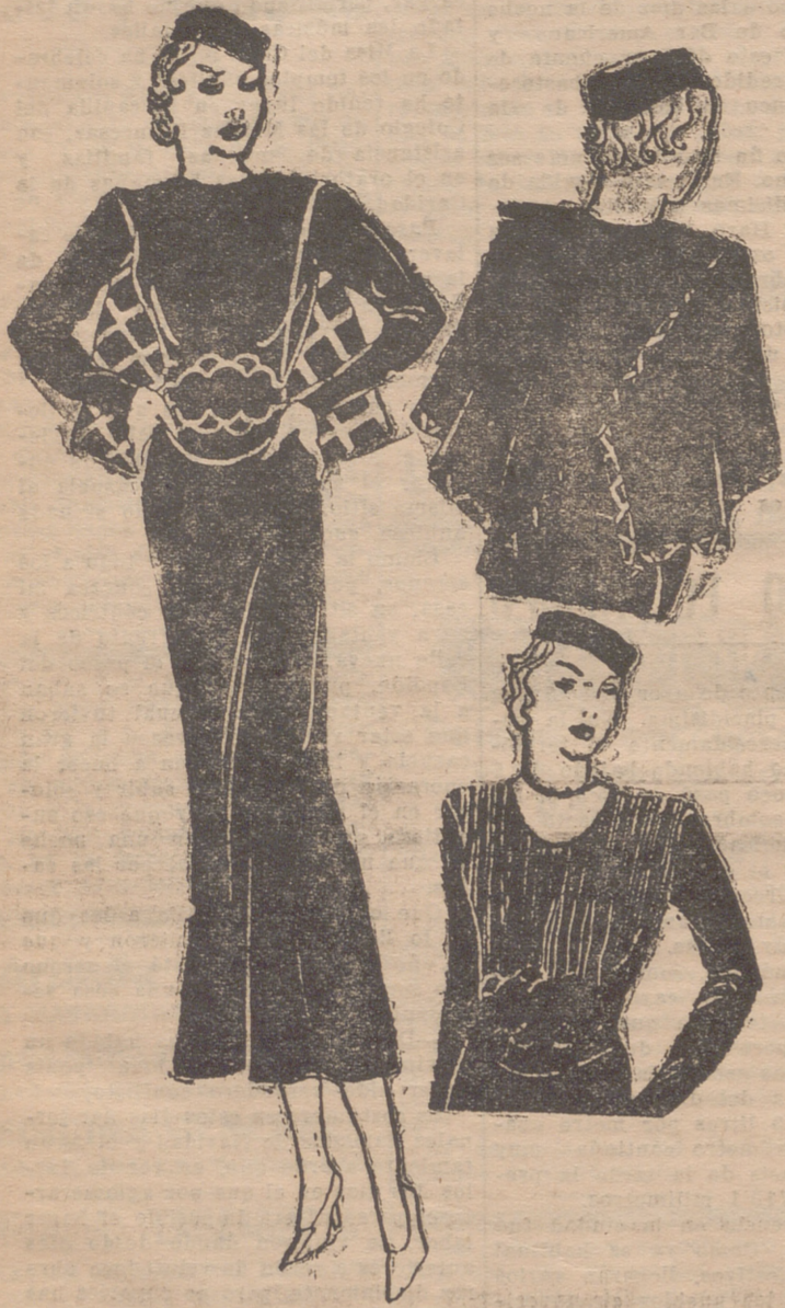
VESTIDO DE TRICOT, de lana negra. La capa, que se cruza en la espalda, está forrada y bordeada por una piel blanca y negra, simulando escocés. En la delantera forma un chaleco sostenido por un cinturón de charol del mismo tono formando dibujos redondos. Al levantar la capa aparece un cuello de seda gruesa blanca y un chaleco de "tricot".