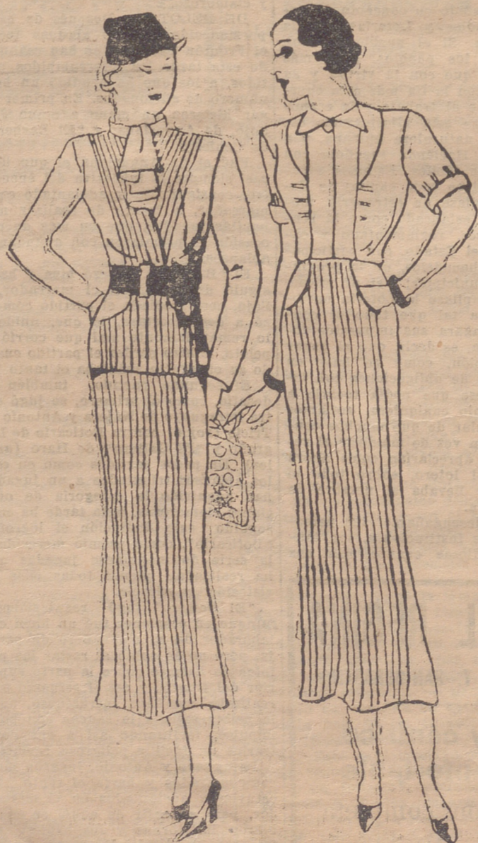
TRAJE SASTRE, de tricot marón, cuya falda está provista de nervaduras verticales que marcan los bolsillos. Blusa de lana color ladvillo quemado. Sobre la chaqueta van las nervaduras antes indicadas. Cuello oficial y chorreras de crepón blanco.

La mujer europea ha realizado, en pocos años, una gran evolución, pero ésta ha sido gradual, progresiva. En cambio, la mujer turca ha realizado todos estos progresos en poco tiempo y hallándose en un punto mucho más atrasado que la europea. Muchas abuelas turcas dicen no reconocer a sus hijas como continuadoras de ellas mismas. Turquía el país del fez, de los velos sobre el rostro, de los serrallos o harenes, de la esclavitud de la mujer al marido... esta tierra con tanto de leyenda y tanto de verdad, es hoy para cualquiera que en ella sueñe encontrar algo de novelaría oriental, algo de-