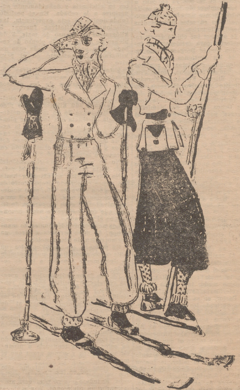
DOS MODELITOS PARA LA NIEVE. El primero es de Bursnow (nuevo tejido impermeable) de color azul oscuro. Pantalón "noruego", de poca amplitud, abotonado a un lado. Echarpe, guantes y gorro de angora, rojo y azul marino. -- El segundo se compone de una chaqueta de paño color mostaza, con aplicación de cuero negro. Pantalón "knickerbocker" de "wood" negro y blanco impermeabilizado. Accesorios de tricot de tono verde vivo, beige y negro. Como detalle técnico se indica que es preciso llevar dos pares de medias, uno sobre otro, y además, zapatillas.