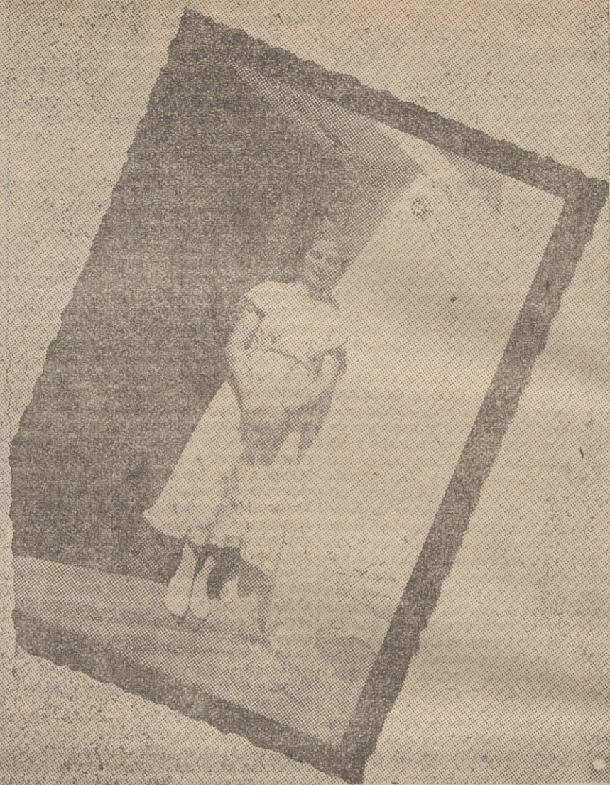
"MISS PIÑUECAR", ELEGIDA POR NUESTRAS TROPAS, QUE HAN DADO PRUEBA, ADEMÁS DE BUEN HUMOR, DE MUY BUEN GUSTO, COMO PUEDE VERSE