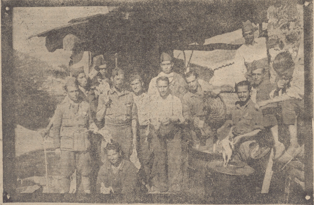
PREPARANDO EL RANCHO PARA LAS FUERZAS DEFENSORAS DE PIÑUECAR