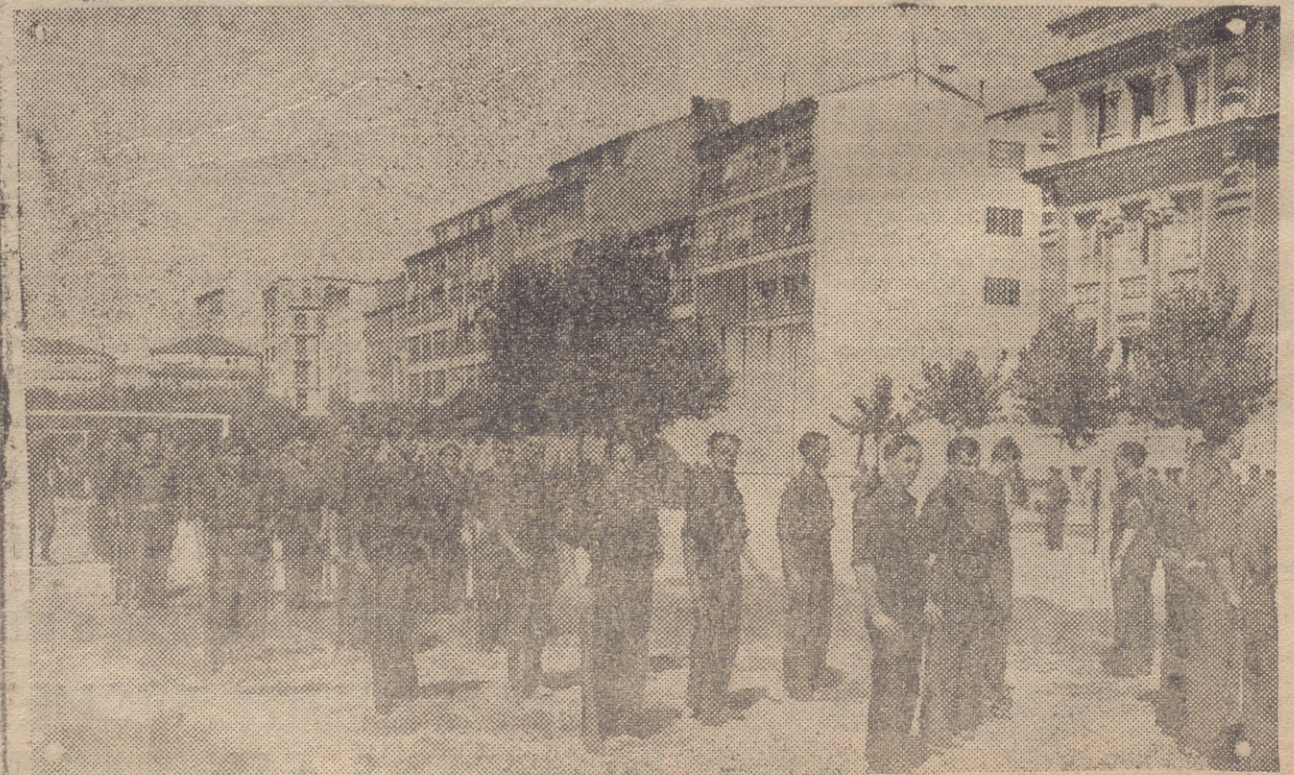
LOGROÑO. — NUESTROS PALANGISTAS SE EJERCITAN EN SU CAMPO DE DEPORTES