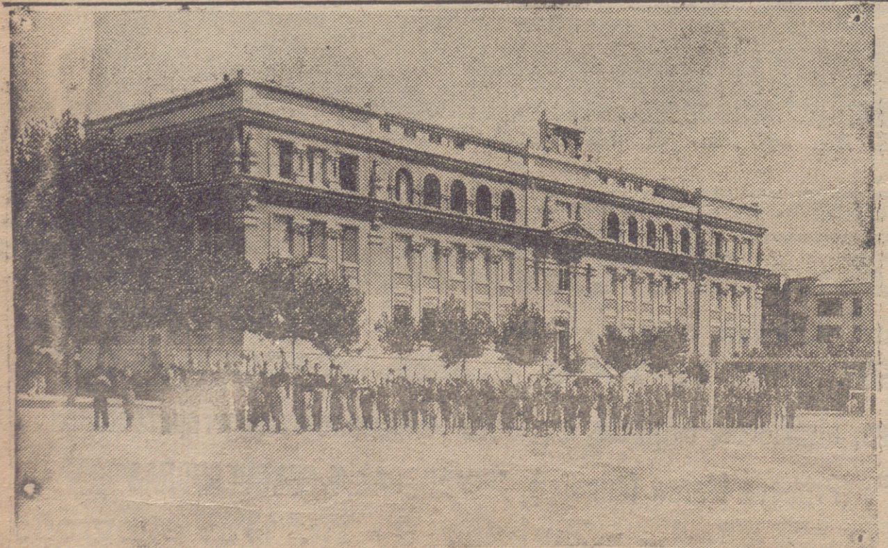
LOGROÑO. — CUARTEL DE F. E.—LOS ENTUSIASTAS BALILLAS ANHELANDO IR AL FRENTE