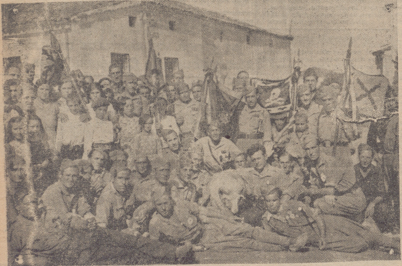
EL TERCIO, ACAMPADO EN CEREZO, EN EL PUERTO DE GUADARRAMA

Cámara oficial de Comercio e Industria SERVICIO DE TRANSPORTES Concedidos por la Comandancia Militar cuatro camiones para atender a las necesidades del Comercio y de la industria provincial, esta Cámara se complace en comunicarlo a sus electores, para que quien pueda necesitarlos acuda a estas oficinas, General Zurbano, 11, tercero, todos los días laborables, de 9 a 1'30 y de 4 a 7, donde se les facilitarán, previa justificación de su necesidad. Logroño, 22 de agosto de 1936.