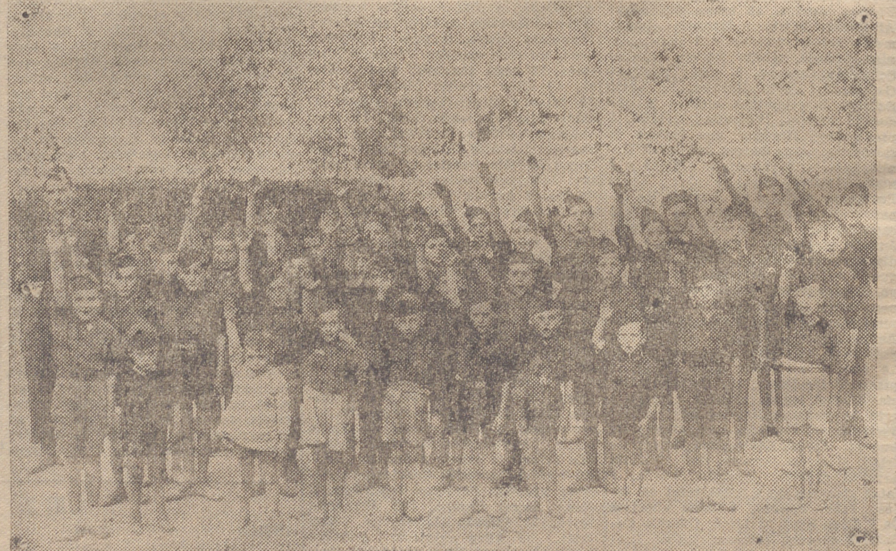
AGUILAR DE RIO ALHAMA. — LOS FLECHAS DE FALANGE ESPAÑOLA CON SU ENTUSIASTA JEFE QUE LOS INSTRUYE MILITARMENTE Y QUE HA LOGRADO DE LA AGRUPACION UNA GRAN APOSTURA MARCIAL