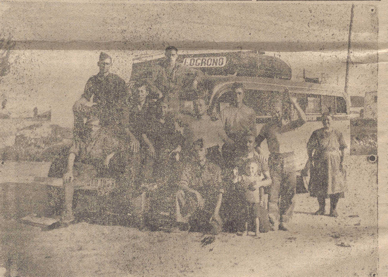
FRENTE DE SOMOSIERRA. — HE AQUI EN SANTO TOME DEL PUERTO UN GRUPO DE CONDUCTORES RIOJANOS CON EL AUTOBUS QUE POR SORPRESA NOS COGIERON LOS ROJOS Y QUE, HA SIDO DESPUES RECUPERADO POR NUESTRAS FUERZAS, CON OTROS VARIOS DE LOS MARXISTAS DE MADRID