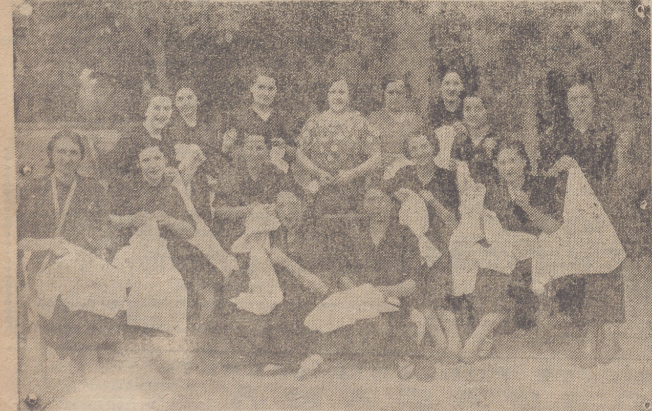
ALHAMA. — UN GRUPO DE AFILIADAS A FALANGE ESPAÑOLA PRESIDIDAS POR SU SEÑORA, QUE REALIZAN CON ACTIVIDAD Y ENTUSIASMO LA CONFECCION DE SUS BOLSAS PARA LOS SOLDADOS Y MILICIANOS QUE LUCHAN EN EL FRENTE