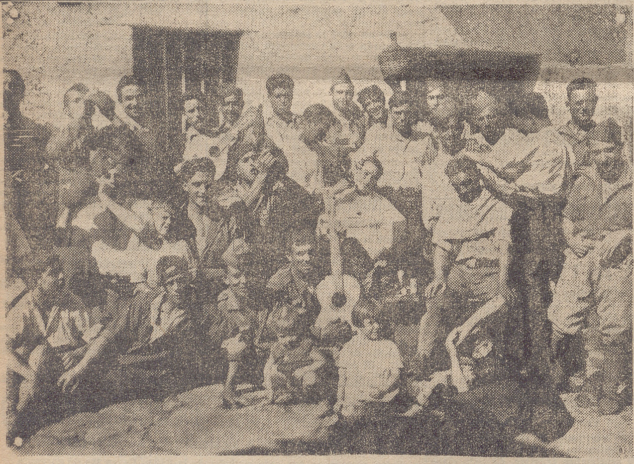
DEL FRENTE DE SOMOSIERRA. — LA HORA DEL ASEO EN PINUECAR. NUESTROS SOLDADOS, CARA AL SOL, TURNAN EN EL AFEITADO Y EL CORTE DE PELO, MIENTRAS LOS QUE AGUARDAN LIBAN, JOTEAN Y HACEN DIVERTIDA LA ESPERA, NO COMO EN GUERRA, SINO COMO EN FIESTA