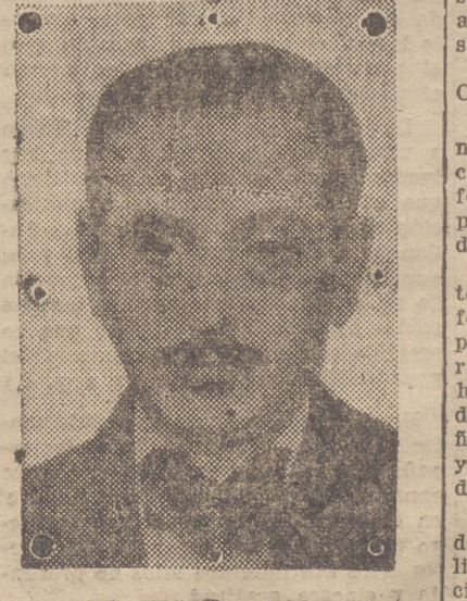
EL SEÑOR PEMAN