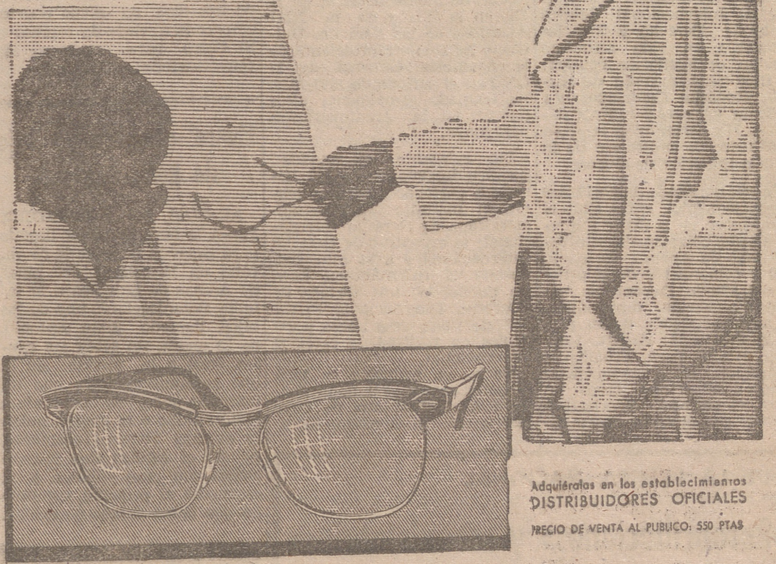
Adquiéraslas en los establecimientos DISTRIBUIDORES OFICIALES