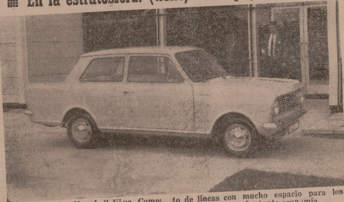
El nuevo Vauxhall Viva. Comp. to de líneas con mucho espacio para los viajeros y para equipajes. Alcanza gran velocidad con bastante economía.

Nos encontramos ante otro "Salón del Automóvil". Earls Court está repleto de modelos 1963-64 no sólo ingleses, sino alemanes, checos, franceses, italianos, suecos y rusos. Esta es la 48 exposición o "Motor Show" organizada por la Sociedad de Fabricantes y Comerciantes del Automóvil. Nuestro veredicto: muy interesante.