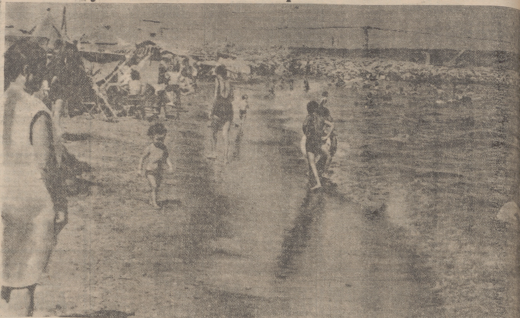
Al principio de este año, Palomares fue un nombre que estuvo en los medios de información y en la mente y los labios de todo el mundo. En aguas cayó una bomba "H" y hasta no recuperarla se vivieron horas de impaciencia y de ahogo. Por esos días se movió en el extranjero, naturalmente, la consabida leyenda negra. Hoy la playa de Palomares, provincia de Almería, presenta este aspecto. La gente se baña, disfruta del sol, de la mar.