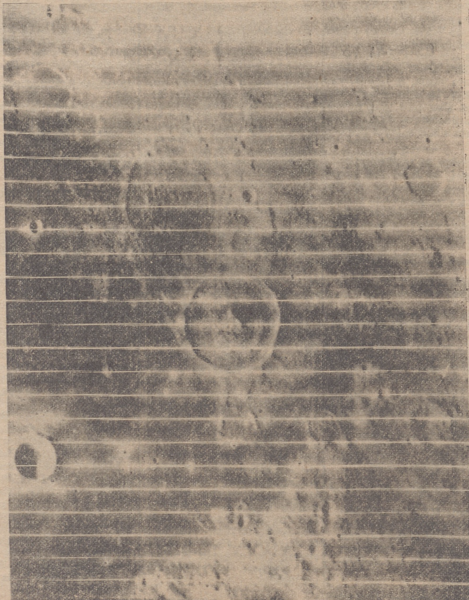
Esta foto de resolución media ha sido recibida en la estación espacial de Robledo de Chavela a las 11'45 del día 19 de agosto, enviada por el vehículo espacial norteamericano "Lunar Orbiter". El área fotografiada corresponde al borde oriental de la Luna, aproximadamente a 90 grados de longitud Este y 0 grados de latitud. Esta parte de la Luna nunca había sido vista bajo el ángulo en que ha sido fotografiada esta vez. Aparecen numerosos cráteres, siendo el diámetro del gran cráter central de alrededor de 30 kilómetros. En la parte inferior izquierda aparece uno más pequeño y profundo de un diámetro de 10 kilómetros. La foto se compone de bandas de película de 35 milímetros que fueron sucesivamente dispuestas para formar el conjunto del área mostrada.—(Foto Fiel).