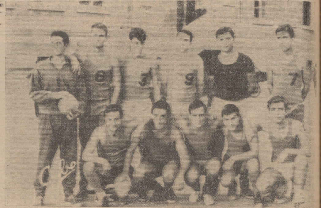
Componentes del equipo Guadarrama, que ayer conquistó el título de campeones del «I Trofeo de Verano» de balonmano, celebrado en el campo de los Maristas.

Ayer se disputó la final del «I Trofeo de Verano» de balonmano. Triunfó el conjunto Guadarrama sobre el Ranger's, en encuentro que finalizó con el tanteo de 7-4. Con esta victoria, el Guadarrama se convirtió en el primer campeón del torneo de balonmano organizado por la Federación Riojana, competición que constituyó un gran éxito.