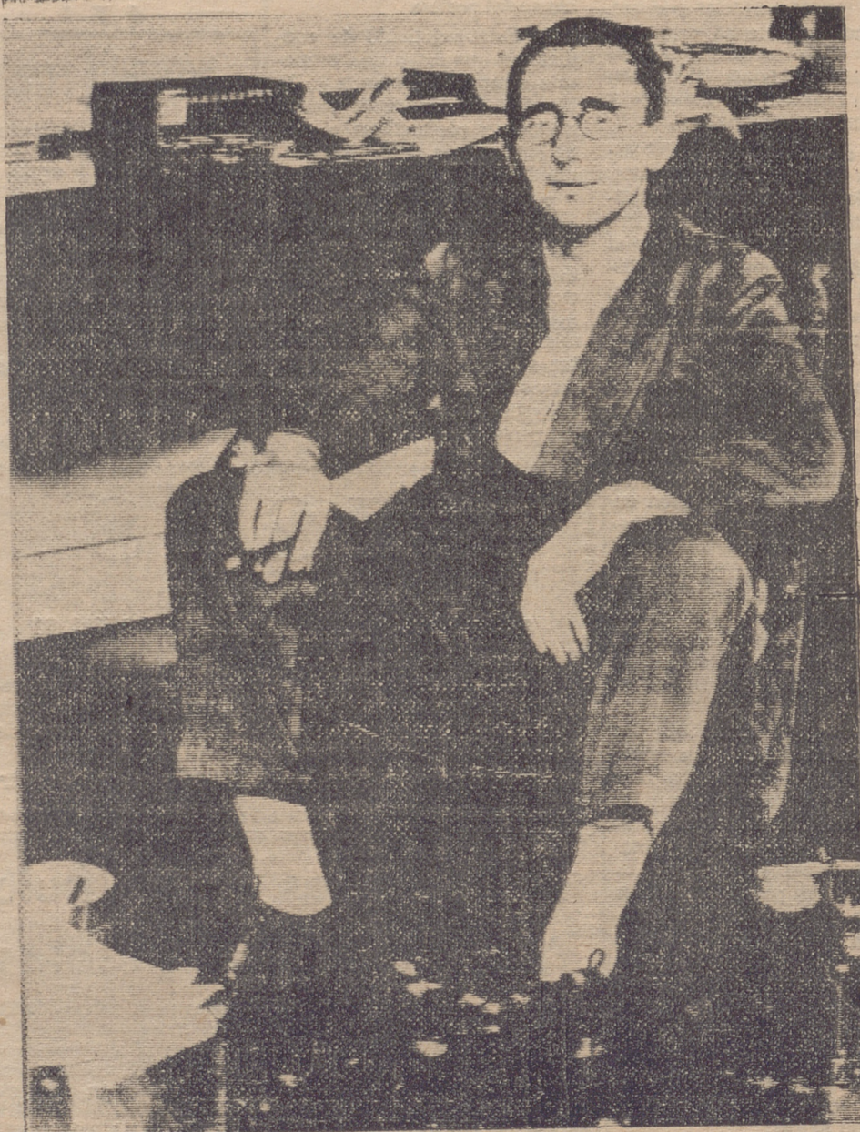
El 14 de agosto se ha celebrado en todo el mundo el X aniversario de la muerte del dramaturgo alemán Bertold Brecht, cuya vida estuvo totalmente dedicada al teatro. Próximo por Hitler, emigró en 1933 a los Estados Unidos, donde fundó en 1949 el conjunto de Berlín, cuya dirección ostentó hasta su muerte en 1956. Bertold Brecht y su actuación constituyen la actualidad cultural alemana.

La desconcertante actitud de una mujer envuelta en un misterioso pasado