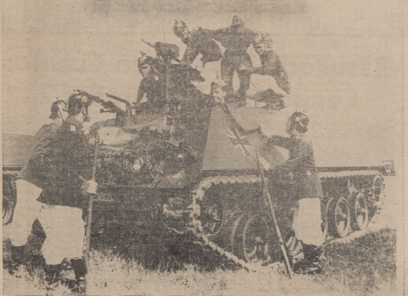
Granaderos de 1866 aparecen fotografiados con carristas alemanes de la Bundeswehr dentro de la exposición de uniformes y armamentos del Ejército alemán celebrada en la ciudad de Hammelburg, en una serie que va desde 1816 a 1876. La fotografía ofrece los contrastes entre la modernidad y el aparatoso esplendor de los uniformes imperiales germanos.