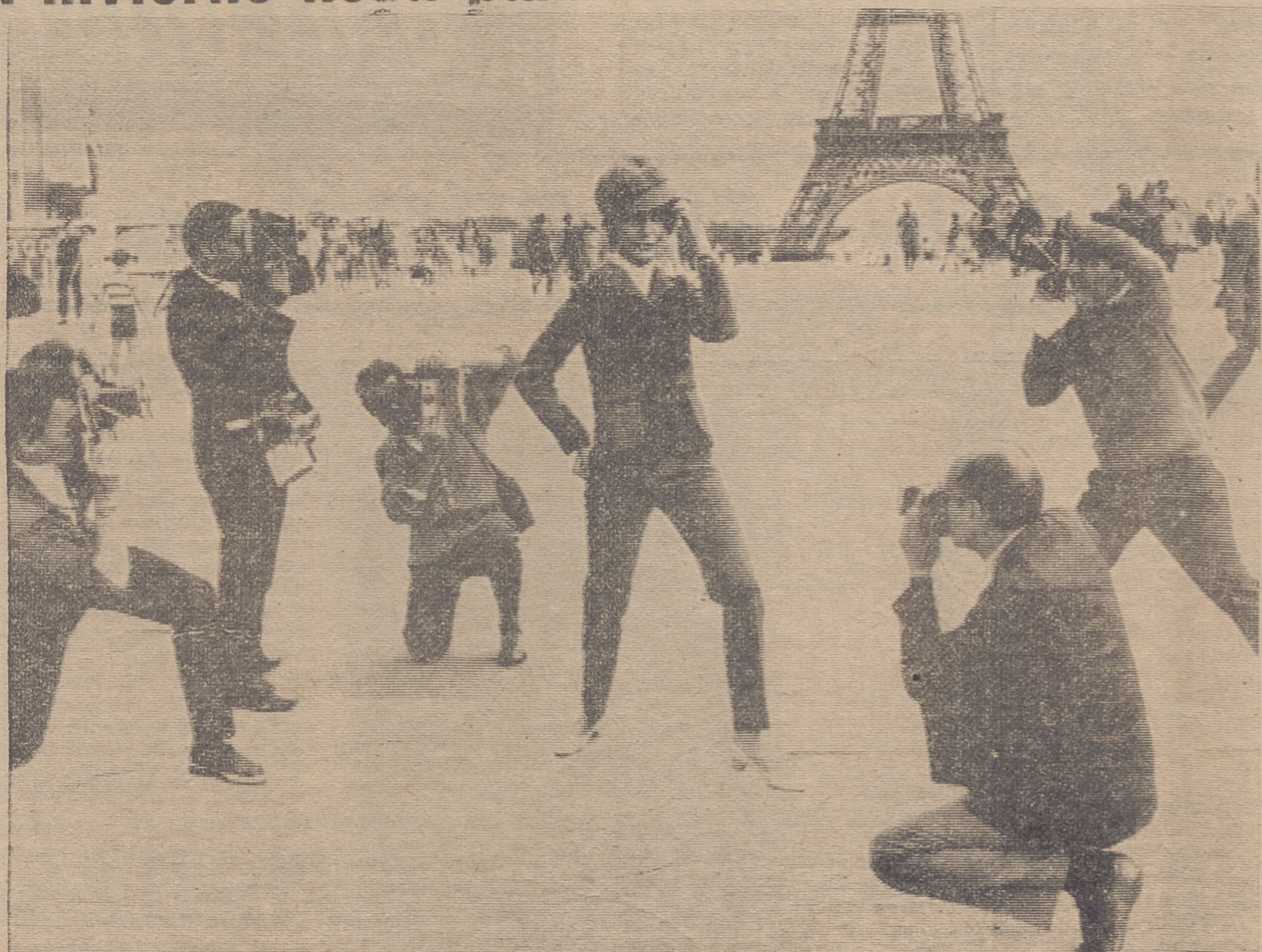
Los modistas franceses han presentado algunas de sus colecciones a la atención de la Prensa en el Trocadero, con este de pantalón, chaqueta y gorra que es recogido hasta en sus más pequeños detalles por las minuciosas cámaras de la Prensa.