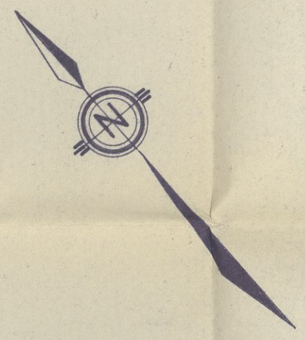
plano de emplazamiento escala 1:200