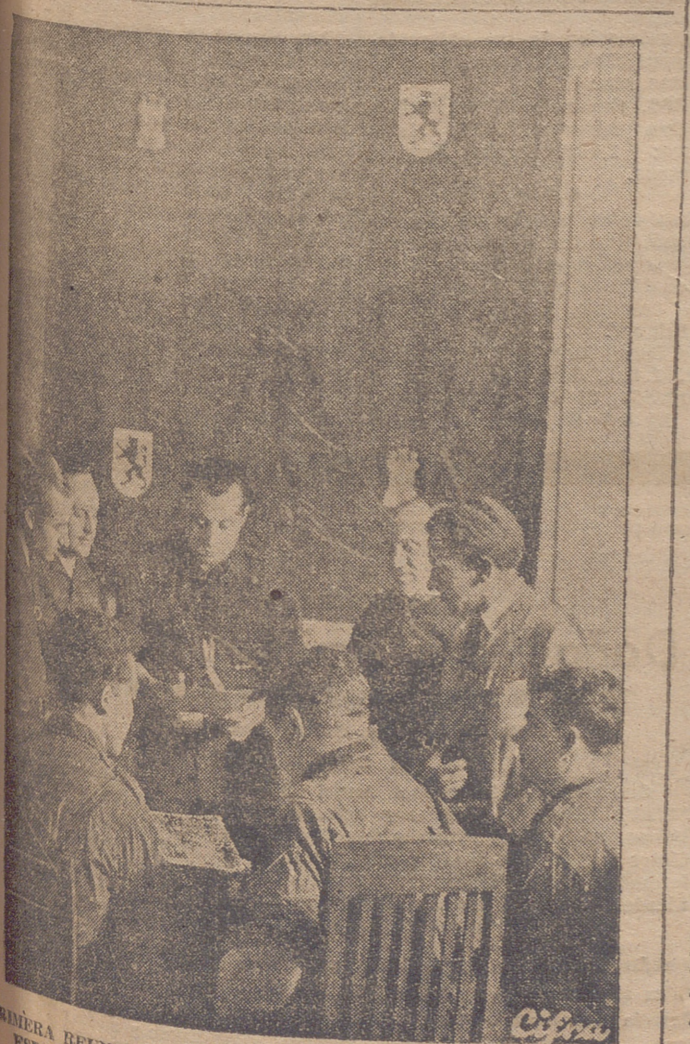
PRIMERA REUNION DEL CONSEJO NACIONAL DE FALANGE ESPAÑOLA BAJO LA PRESIDENCIA DE JOSE ANTONIO

Al cabo de estos nueve años, nos aparece Falange, como un movimiento de juventudes que, sin hallar en su tradición inmediata nada firme en que apoyar la cabeza ni el corazón, se lanzaron a la aventura de conquistar una manera de vivir y de sonar al mundo con intimas llamadas religiosas y con afanes de buscar el humano en la fortuna y en la adversidad. Por eso, como fruto de nuestras experiencias tremendas y nuestras no menos terribles especulaciones, podemos decir hoy que nada importan los programas, si nuestra vida fluye animada de piedad y de afanes entrañables. También hemos aprendido que sin ese afán religioso que nos da fuerza y calor a todos los impulsos más nobles de esta tierra, que servirá de nada ni los más sensados propósitos, ni las más saludables aspiraciones. Y de esto encontramos buena prueba los fundadores de Falange Española, en aquellas generaciones que vivían en la esperanza, esperando la hora en que el espíritu estético de la cultura, ya enajenado de una doctrina y dueño de un inmenso imperio, se fuera apoderando de Europa.