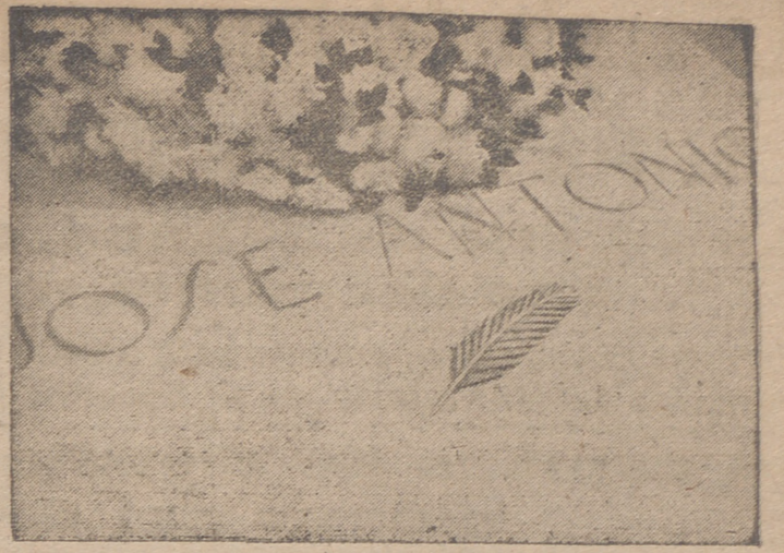
SOBRE LA LOSA QUE CUBRE LOS RESTOS DE JOSE ANTONIO EN EL ESCORIAL, LA PALMA DE ORO COLOCADA POR EL CAUDILLO

El 9 de septiembre de 1933, Lerroux fue encargado. La opinión predominante de las Constituyentes, se resumía así: "Lerroux y los radicales se llevarán hasta las alfombras de los ministerios". "Para gobernar con prebenda haecce el señor Lerroux, bastan diez gitanos de las Peñuelas". Las fuerzas republicano-socialistas, de las que se habían apartado los radicales, depusieron la Hacienda Pública y hundieron la Economía nacional. Los presuntos sucesores no inspiraban mayor confianza. Aún se creía que los hechos lo demostrarían —que realizarían una parecida labor inhumana. El 12, Lerroux formó Gobierno. Lo componían representantes de todos los partidos del bienio republicano, a excepción de los socialistas. El jefe radical se comprometió a respetar las leyes autonómicas, laicas, y de reforma social y agraria. A pesar de ello, fue derrotado el día 2 de octubre en las Cortes, y presentó la dimisión el día 4. No podía volver a ser jefe de Gobierno con las Constituyentes en virtud del artículo 75, que prohibía al Pre-