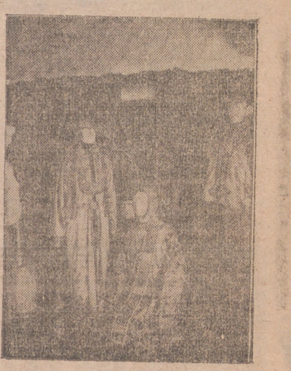
Tipos del Tibet, con su vestuario típico en una exposición misionaria.

El Confucioismo, conjunto de doctrinas morales, políticas y sociales de Confucio, fué considerado mucho tiempo como una religión puesto que cierto número de poblaciones asiáticas, y particularmente los chinos, aceptaban esa doctrina co-