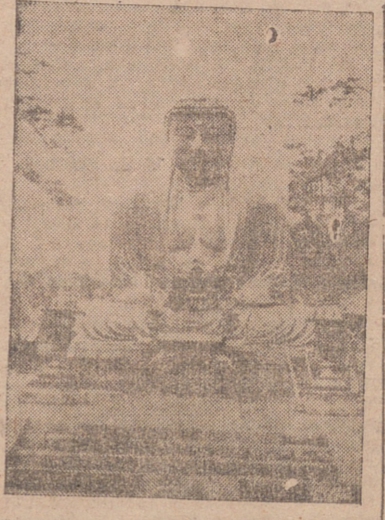
La gran estatua de Buda, en Kamakura, la antigua capital de Japón occidental.

El invidible cardenal Van Rossum, prefecto de la Sagrada Congregación de Propaganda Fide dijo que este día es la verdadera fiesta del apostolado y gran día de la catolicidad. La obra de la Propaganda de la Fe fué creada en 1822 y ha ido extendiéndose por todo el mundo. Cuenta actualmente con varios millones de afiliados que se comprometen a entregar sus obolos anualmente y rezar a diario un Padrenuestro y la jaculatoria «San Francisco Javier, rogá por nosotros». En este día, cada año aumenta en varios millones la cifra de estos afiliados. Pero todavía son pocos. Es grande la labor a realizar; gigantesco el campo sobre el que ha de trabajarse. Pero si no nos satisficemos, tenemos motivos para estar complacidos, en lo que respecta a España, del apoyo prestado por los fieles a esta gran obra de la cristianización del mundo infiel. En las colectas realizadas el pasado año se llegó a cifras nunca alcanzadas. En las que hoy han de verificarse, aquellas cifras serán sin duda superadas. Y así ha de ser, porque repetimos, que es gigantesca la labor a realizar, y porque España, por su tradición, y por su historia, debe figurar, debe seguir figurando, entre los países más destacados de la actividad misional.