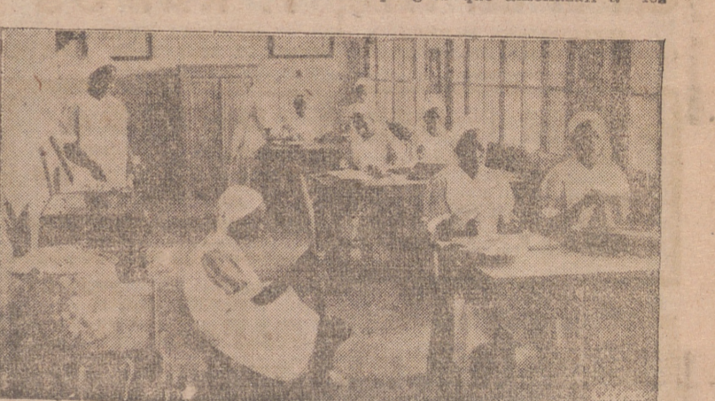
Una escuela del hogar establecida por monjas misioneras.