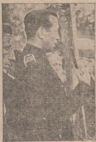
El Excmo. Sr. Gobernador Civil y Jefe Provincial, en un momento de su discurso.

cios, increpa, blasfema de Dios o se suma a los enemigos de España y del Caudillo, es un mal nacido y no merece ni respirar siquiera las auras benditas de la paz.