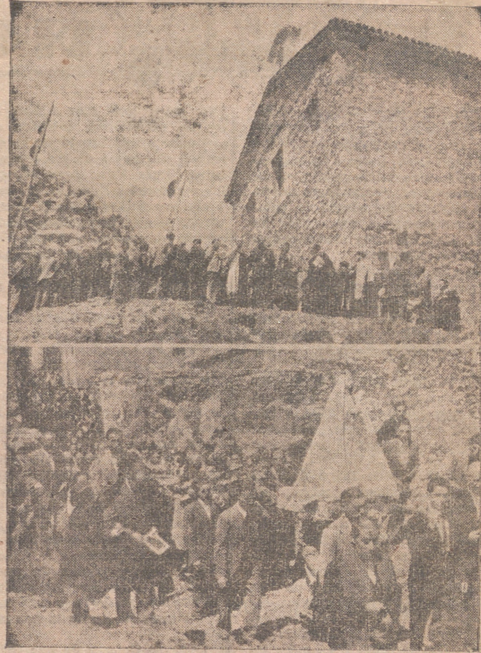
LAS AUTORIDADES CONTEMPLAN DO EL CAMPO DONDE SE DESARROLLÓ LA BATALLA DE CLAVIJO Y UN MOMENTO DE LA PROCESION.