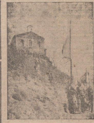
La procesion descendiendo de la Basílica.

Señaló los peligros que para la vida de familia se derivan del desconocimiento e incumplimiento de la misión y deberes inherentes a la madre y al padre, el daño causado por las modernas teorías marxistas, comunistas, etc., contrarias al verdadero concepto del patriarcado y patriarcado y a las relaciones que han de existir entre padres e hijos, y lo demoleitor que para el hogar