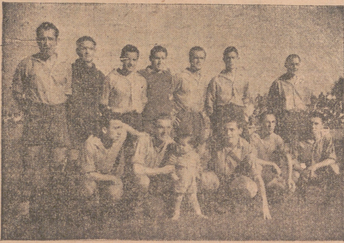
EL EQUIPO OSASUNA, DE PAMPLONA, QUE EMPATO A 2 CON MAESTRANZA AEREA

Arbitró, a instancias del D. Logroñés, un colegiado aragonés, sin grandes dificultades. OTROS RESULTADOS DEL GRUPO