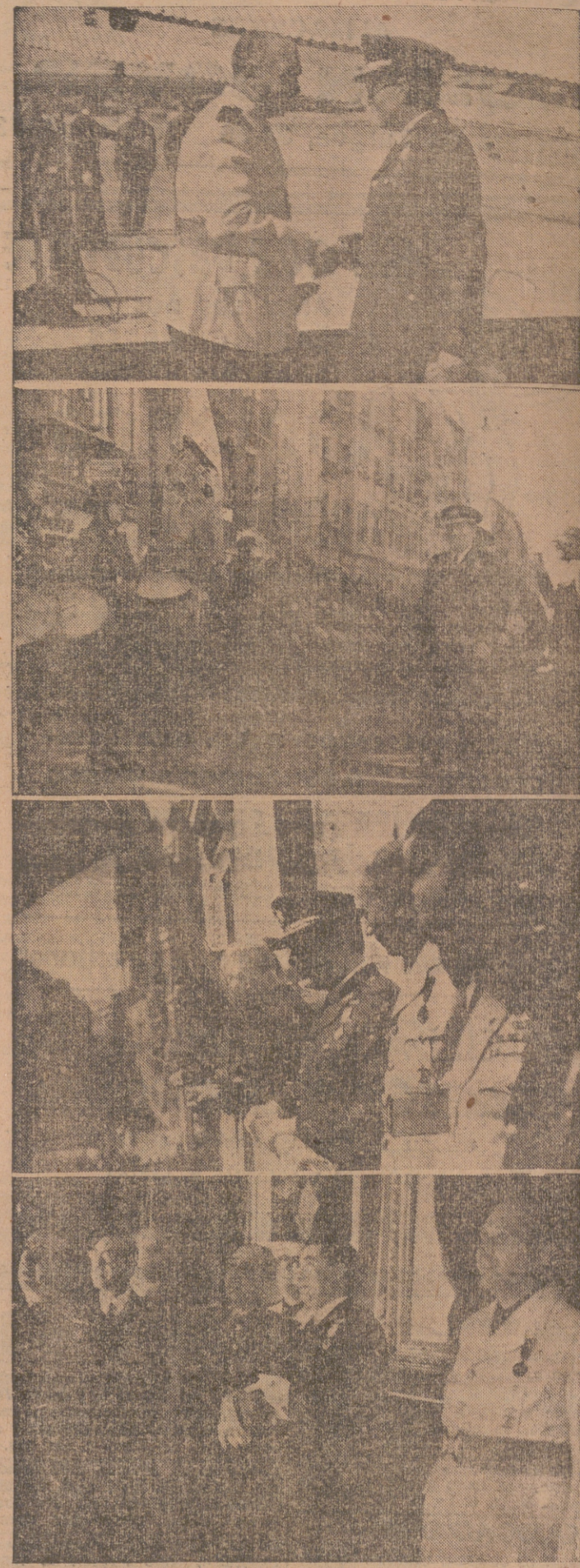
Diversos momentos de la llegada del ministro del Aire al aeródromo de Agoncillo y de la recepción celebrada en el Ayuntamiento.

Entrada para visitar la Exposición: 3 Ptas.