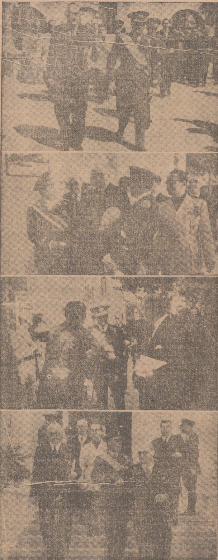
El ministro del Aire y demás autoridades, en el acto inaugural de la II Exposición Regional de Productos de Ambas Castillas.