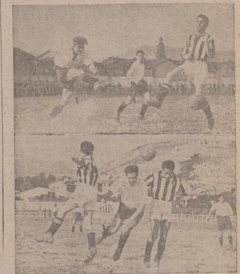
Las muestras de la furia de los harenos (de blanco), en el partido del sábado.

Por la noche, los jugadores del Baracaldo, directivos y acompañantes, fueron obsequiados con una cena en las importantes bodegas de la entidad «Federico Paternina S. A.», asistiendo también una representación del «Haro Deportivo»