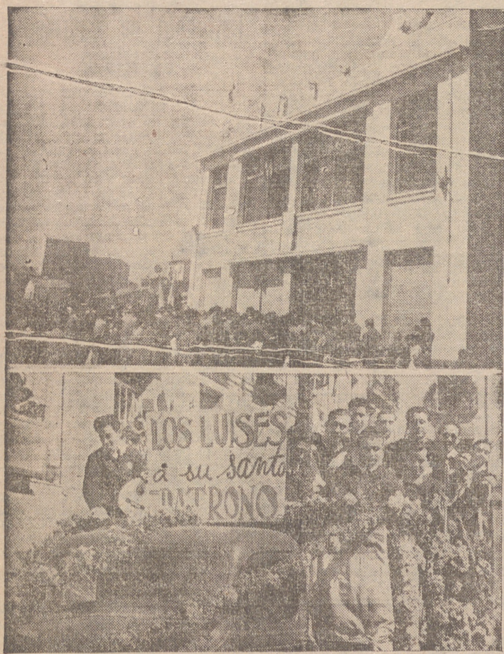
Arriba, el nuevo edificio de la Escuela de Aprendices "Julio Pernas". Abajo, la Estudiantina de la Congregación trasladándose a los actos en engalanado camión.

Este año ha alcanzado un éxito clamoroso e inusitado por su propagandística organización y refinado gusto, el festejo anual de la Congregación Mariana de Logroño, dedicado a San Luis.