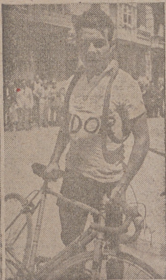
El vencedor, y un momento de la llegada. (Fotos y grabado Cortés Payá)

Educación y Descanso, hemos de consignar su agradecimiento sincero a las fuerzas de la Guardia Civil que, en todos los puestos de la carrera, hicieron acto de presencia, colaborando para la mejor Roja Española por su altruista servicio durante toda la prueba; a la Policía Armada y de Tráfico por su magnífico espíritu y colaboración, y a los guardias municipales de Haro, Santo Domingo, Nájera y Logroño por sus servicios.