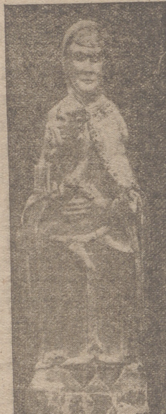
Al son de clarines y entre quebras de auroras de fiestas anunciamos a todos que en fecha ya próxima, a últimos del presente mes de septiembre...