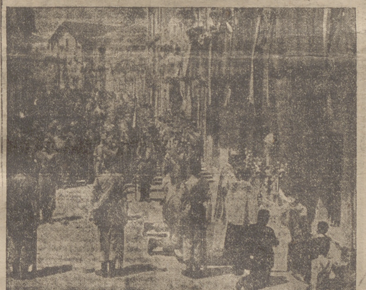
Un momento de la misa de caupanía, con los caballeros cadetes formados al fondo.