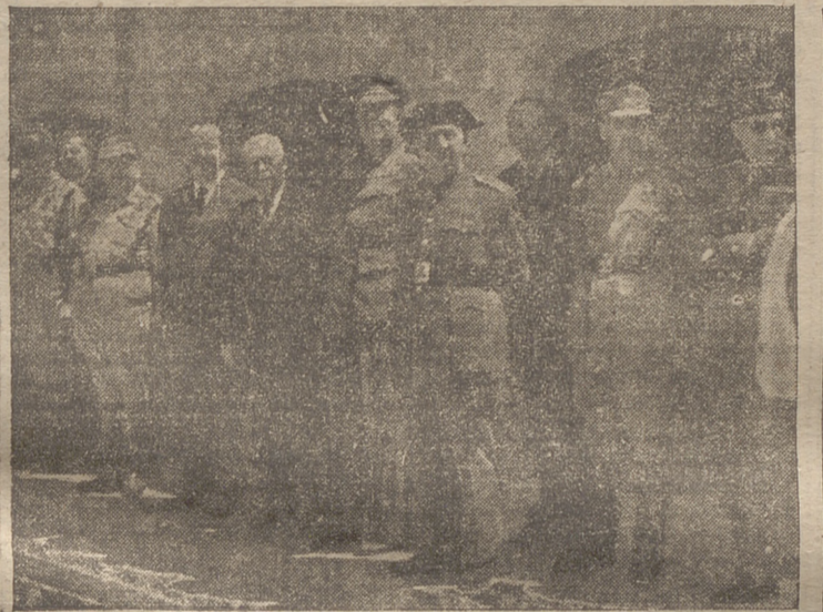
Las autoridades provinciales y locales, dispuestas para presenciar el desfile de los caballeros cadetes. — (Foto Wamba).