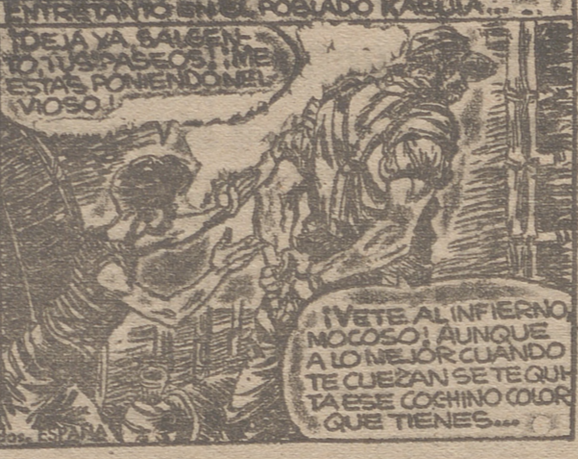
ESTUDIOS HISTORIAS - 1954. Derechos reservados. ESPAÑA