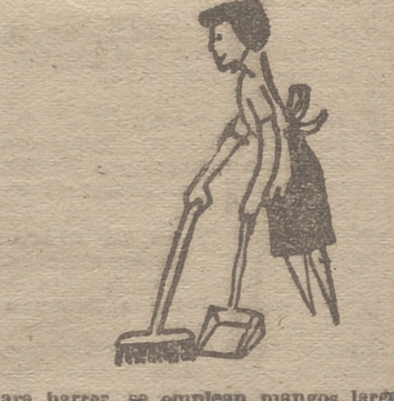
No es necesario agachar el cuerpo para barrer, se emplean mangos largos

cciones, a primera vista insignificantes de cardiología, muchas madres de familia han podido reintegrarse a la vida normal del hogar. La Asociación Norteamericana de Cardiología y sus sociedades filiales se han ganado la gratitud de centenares de mujeres cardíacas que estaban completamente al margen de las quehaceres domésticos y cotidianos, y ahora son lo suficientemente valerosas para llevar otra vez a cargo de la casa, y lo que es más, se ha curado del agotamiento psíquico en que se debatían.