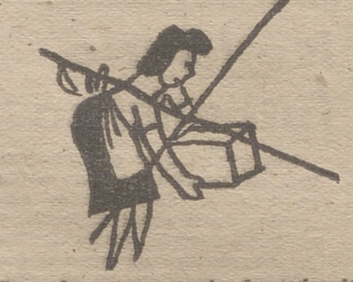
Para alzar pesos, amplex los músculos fuertes de la espalda y las piernas