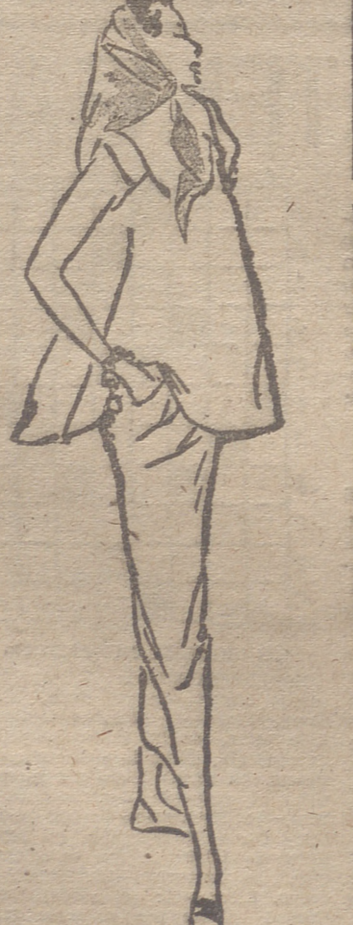
En el casino, que si hay ocasión de bailar sin ceremonias. Para esas horas se señala, dos modelos; un vestido descotado en oval con falda no muy ancha y muy corta, es encaje de seda rosa pálido, con un gran