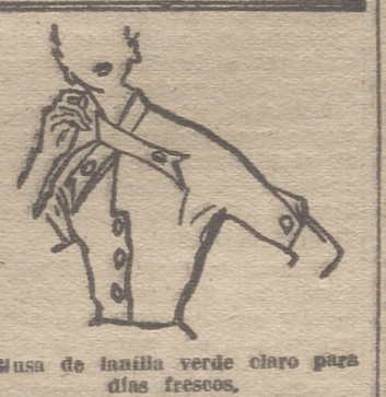
Busa de lanilla verde claro para días frescos.

Suprima los regímenes severos para adelgazar. Si quiere tener una silueta esbelta prive de los dulces y las grasas excesivas, del exceso de pan y procure nadar mucho. Coma muchas verduras y recuerde que la fruta, los huevos y la leche, son alimentos completos. Cómalos.