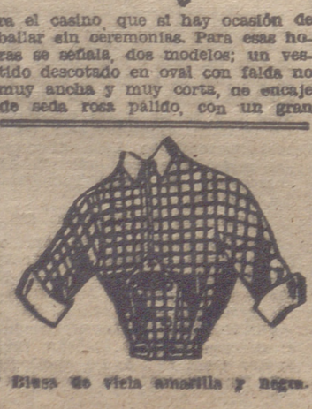
Busa de violeta amarilla y negro.