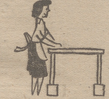
Unos tacos bajo las patas de la mesa elevan su altura y ahorra esfuerzo

Los norteamericanos, hombres prácticos por excelencia, han fundado una Asociación de cardiología en la cual se dan clases dos horas por semana y en que se admiten a las amas de casa que sufren o están propensas a dolencia del corazón. Estas clases especiales tienen por objeto dar orientaciones detalladas y específicas para que puedan hacer sus labores del hogar con eficiencia y sin fatiga.