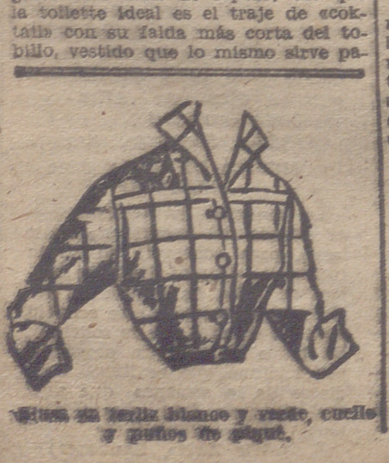
Blusa de tejido blanco y verde, cuello y puños de algodón.