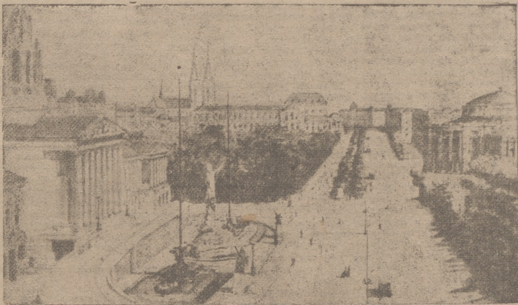
VIENA.—He aquí un cuadro de la colección de pinturas de Adolfo Hitler, realizado en 1911. Representa una vista de Viena y ha sido puesto en venta por el coleccionista Fred Fischer. Está tasado en 300.000 pesetas, aproximadamente.