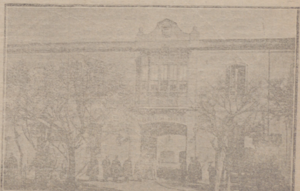
CUARTEL DE ARTILLERIA