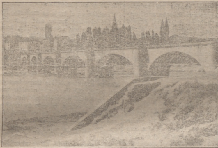
PUENTE DE PIEDRA

El de piedra, obra al fin esbelta y sólida, venía siendo muy castigado por las avenidas del río en 1583, en 1607, en 1616, en que se gastaron en reparaciones 6.000 ducados; en 1670, en que una asombrosa avenida, registrada en los días 17 y 18 de diciembre, lo puso en peligro de inminente ruina, durante la reparación hasta 1762; en 1701, en que se arrojó el último arco; en