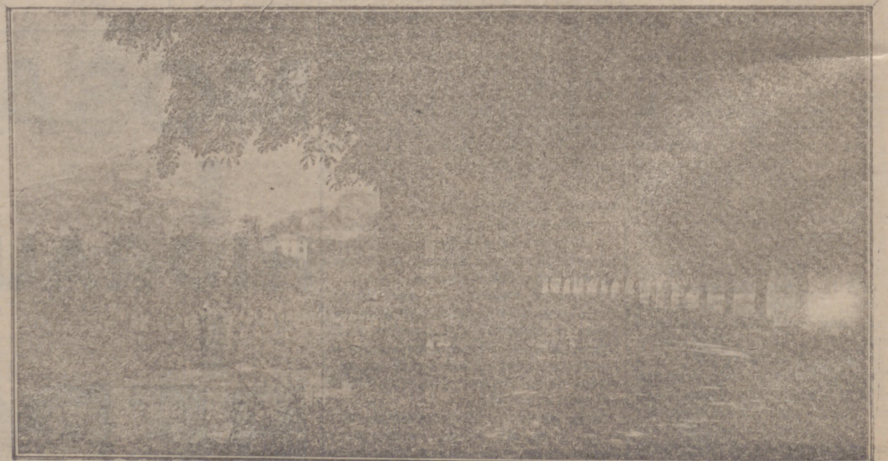
Torrecilla de Cameros.—El túnel de los Castaños