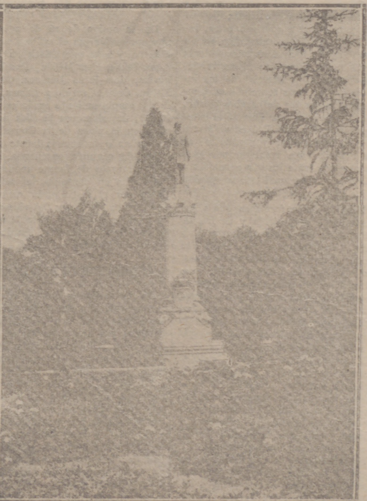
ESTATUA DE SAGASTA EN LOS JARDINES DEL INSTITUTO