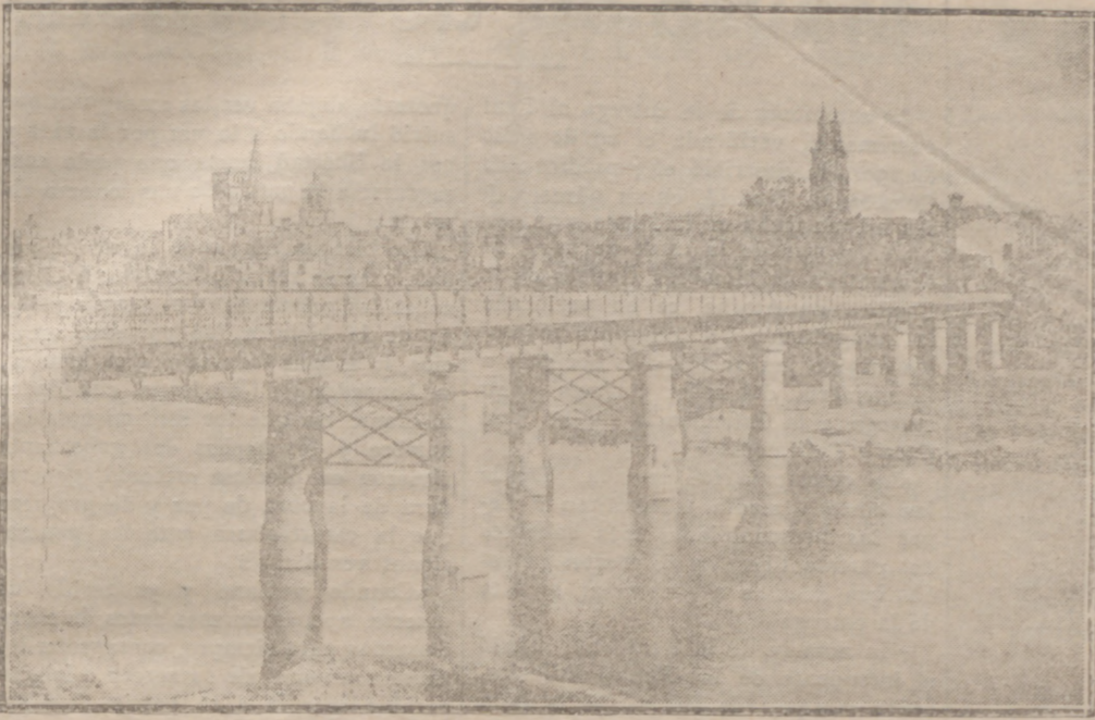
PUENTE DE HIERRO

En la tarde del 6 de enero se publicó un bando haciendo saber al público los acuerdos tomados por el Ayuntamiento en la repetida sesión, y poco después se repartió profusa-