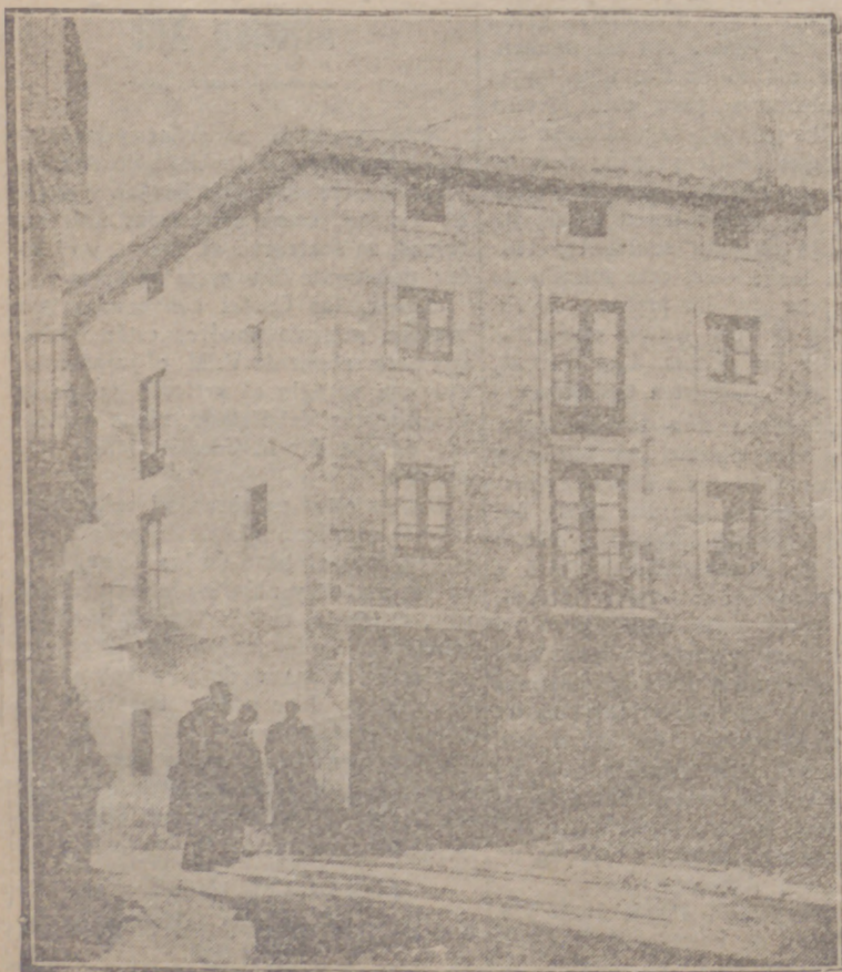
La casa en que nació Sagasta, en Torrecilla de Cameros.

Torrecilla de Cameros julio de 1925. Torrecilla de Cameros julio de 1925.