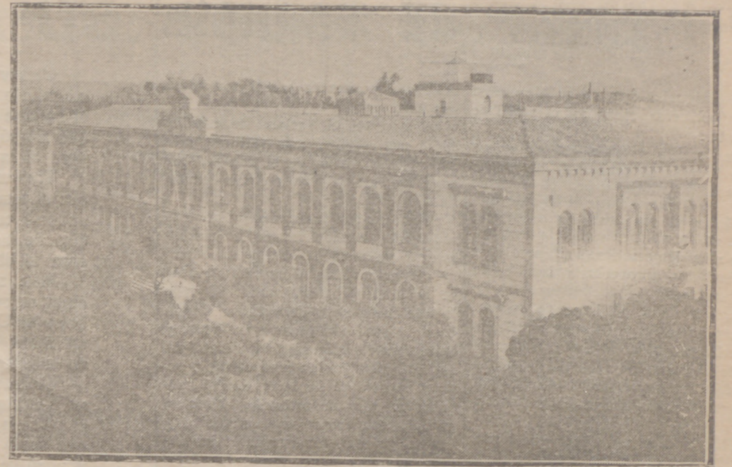
INSTITUTO DE 2ª ENSEÑANZA