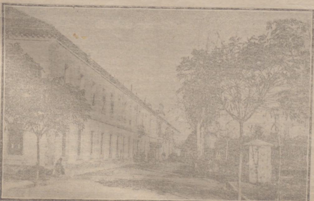
CUARTELES DE INFANTERIA