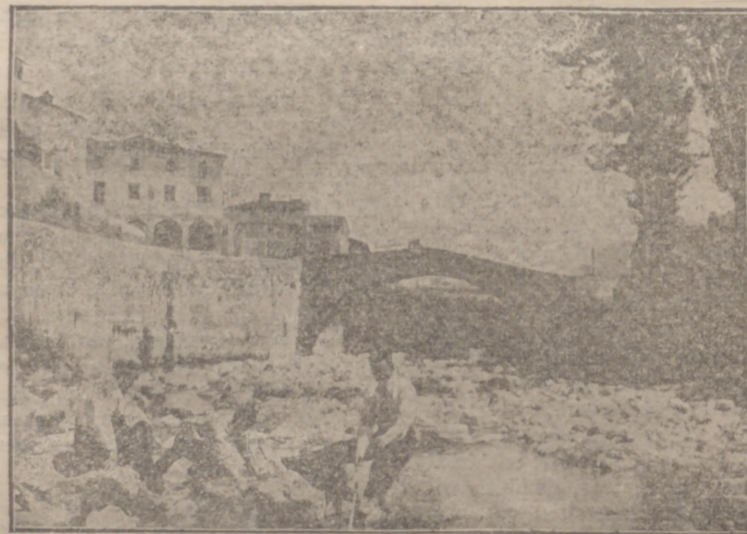
Torrecilla de Cameros.—A orillas del Iregua