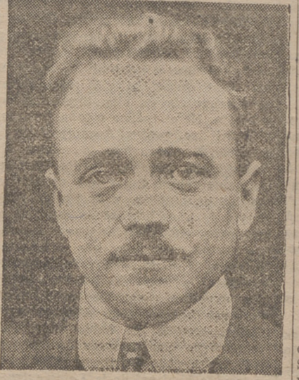
Dollfus, canciller austriaco, que tan tenaz resistencia opone a la influencia hitleriana en su país

Los diarios liberales y socialistas afirman la imposibilidad de justificar la detención y expulsión del diplomático austriaco como represalia contra la expulsión de Habicht en Austria. Austria no podía obrar de otra manera respecto al inspector del partido comunista.