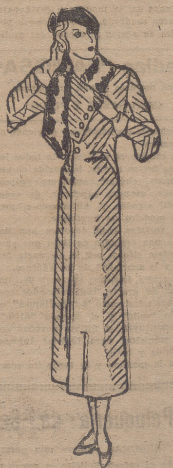
Abriego de "cottpyl" marrón. Ouello asimétrico de renard marrón claro.

Noche.—Selección musical a cargo del quinteto de la estación. Recital poético a cargo de la señorita Fifi Eraso, alumno del Conservatorio Nacional. Cátedra de Enrique Chicote. Boletín Meteorológico, Noticias, Cierre.