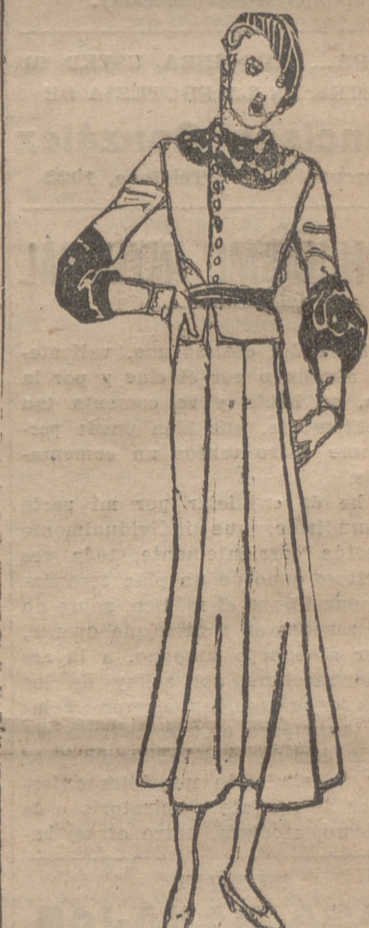
Un bonito vestido para los días otoñales.