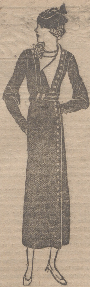
Elegante "robe manteaux" para los días frescos de septiembre.

Se ha dado en decir que el hecho de contemplar a la mujer, sin ningún género de atavíos, sin desparter en el hombre deseo carnal alguno, implica cultura de una parte, y de otra, hábito de convivencia en ese plan desnudista por el que se aboga. Para mí, sin embargo, existe una razón de peso, que contramodifica la