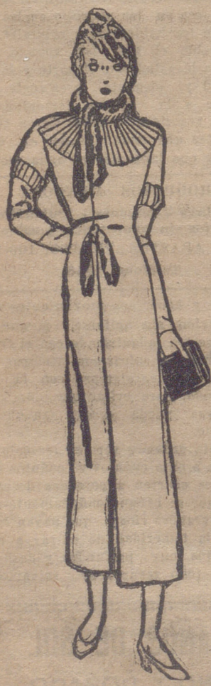
Abriego de forma princesa en "pañó de seda" castaño, cerrado por un cuello corbata y nudo de castor.