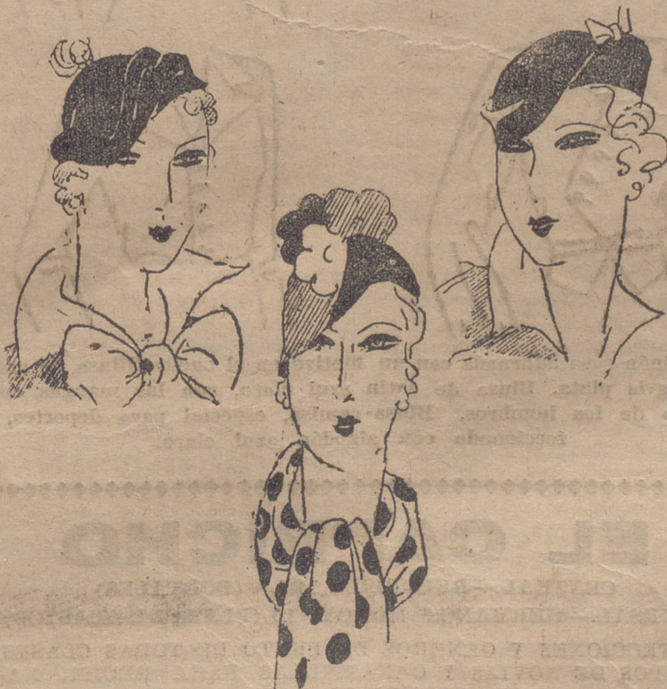
Tres elegantes modelos de sombreros.