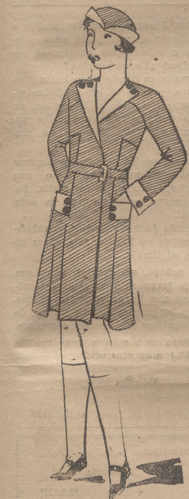
Abrijo para niña de lanita azul, con vueltas, bolsillo y bocamangas de piqué blanco.

Cada día podemos ver en las columnas de la prensa cuántos y cuántos casos fatales ocurren a personas desprevenidas que se bañan confiadamente en el mar y grandes ríos y que pagan con su vida la temeridad de entrar a nadar a sitios muy profundos y desprovistos de todo recurso de salvame-