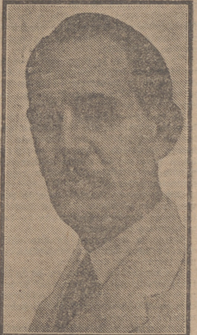
GRAU SAN MARTIN

HABANA.—A las nueve y media de la noche el Gobierno ordenó el comienzo de la ofensiva a fondo contra los revolucionarios. Se ha abierto el fuego sobre la estación Central de Policía.