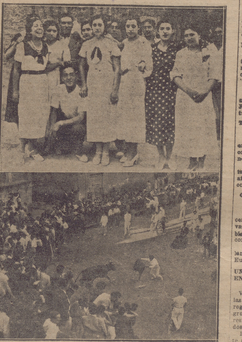
LAS FIESTAS DE VIENA.— Grupo de bellas señoritas, que con otras muchas han sido el mayor atractivo en estos días. Un aspecto de la plaza durante la fiesta taurina de ayer

Los yanquis Wood y Shields han resultado vencedores sobre los austriacos y el próximo sábado, lunes y martes, disputarán la final a los ingleses, que son los actuales detentadores de la Copa Dawis.