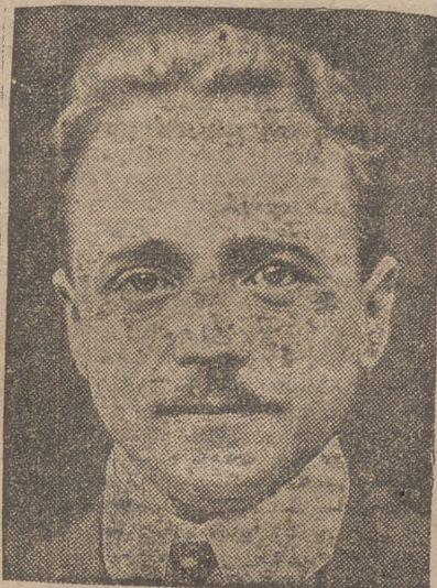
El Canciller Dollfus

Un grupo de nazis entró por sorpresa, cuando estaban reunidos los miembros del Gobierno, a los cuales hicieron prisioneros.