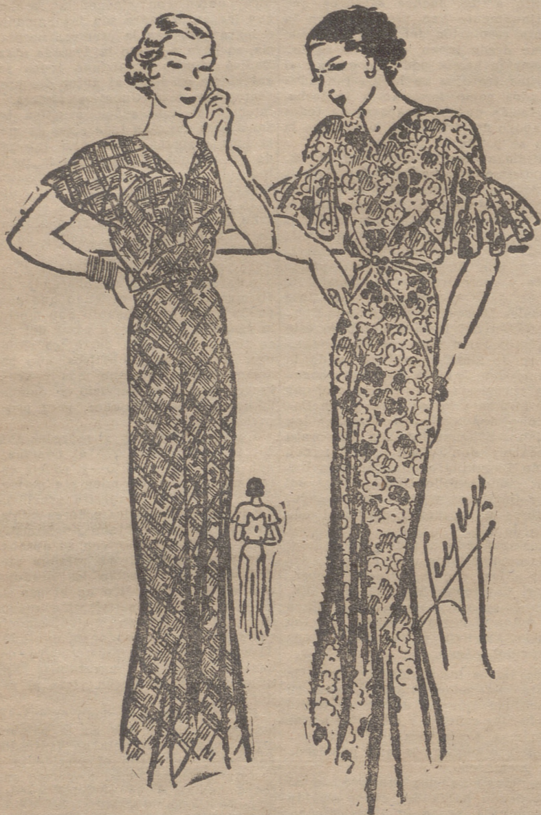
Vestido de crepé impreso con flores rojas, azules y amarillas, sobre fondo negro.—Vestido de tafetas a cuadros rojos, sobre fondo blanco.