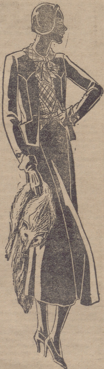
Traje sastre de lana marino, sobre una blusa de seda a cuadros azules.

Los de cuero son algo anchos y de un centímetro de espesor y se abrochan con unos magníficos "clips" de metal. Los hay muy vistosos de pelo y de seda trenzados, abrochándose con hebillas de pasta imitando a la perla, conchas marinas. Hace muy elegante, llevando sobre el vestido de tarde, botones en forma de conchas de mar, combinadas con la hebilla del cinturón y los adornos iguales del sombrero y de los zapatos. Pero