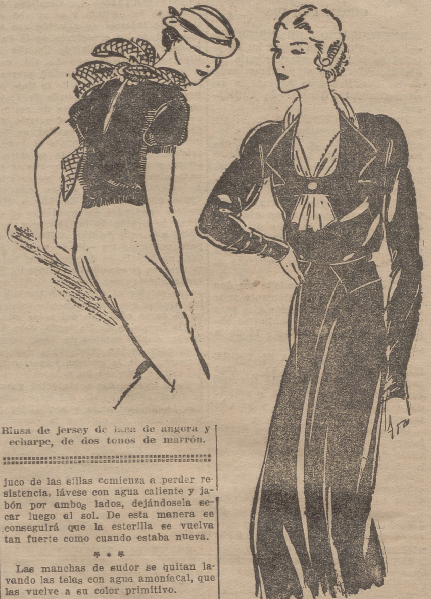
Blusa de jersey de lana de angora y echarpe, de dos tonos de marrón.

Juco de las sillas comienza a perder resistencia. Lávese con agua caliente y jabón por ambos lados, dejándose a secar luego al sol. De esta manera se conseguirá que la esterilla se vuelva tan fuerte como cuando estaba nueva.