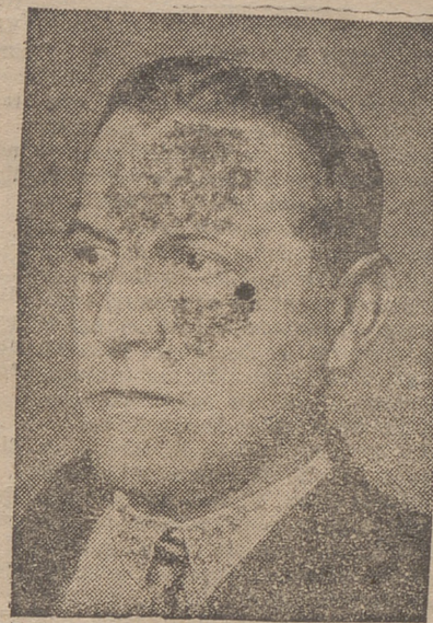
El Vicecanciller Fey

Al encargarse el jefe provisional del Gobierno dió un plazo de un cuarto de hora para que los nazis abandonaran la Cancillería, prometiendo dejarles libre el camino de Alemania, siempre que los ministros que estaban en rehenes