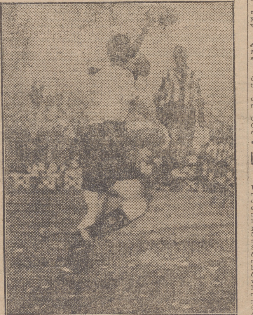
UN MOMENTO DEL PARTIDO DE AYER

—Nuestro corresponsal en San Sebastián, don Angel Gorrochategui, nos comunicó el resultado de las ocho corridas celebradas en dicha capital en el año actual, las cuales fueron por acciones; el producto bruto de las ocho entradas fué de 463.719'84 pesetas, o sea un promedio de pesetas 57.968'93 por corrida, y el gasto total de las mismas ascendió a 249.847'79 pesetas, con un promedio de 43.730'97, también por corrida, resultando un promedio de ganancia bruta de 14.237'96 pesetas por corrida; dándose por primera vez un dividendo a las acciones de 4 por 100. Los espadas que tomaron parte fueron Relampagueto, que cobró 3.500 pesetas; Minuto, 3.500; Bombita, 6.500; Machaquito, 6.000; Cocherito 4.000; Vicente Pastor, 3.500; Regaterin, 3.250, y Algabaño, 4.000. Los seis toros de la corrida concurso costaron 17.000 pesetas, sin contar gastos, incluido el premio de 5.000 pe-