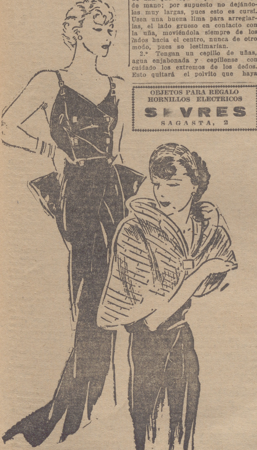
Vestido de faille de seda, adornado con botones claros de strass. — Vestido de terciopelo negro y capa de armiño.

Calzados ANTON Últimas Novedades SAGASTA, 12