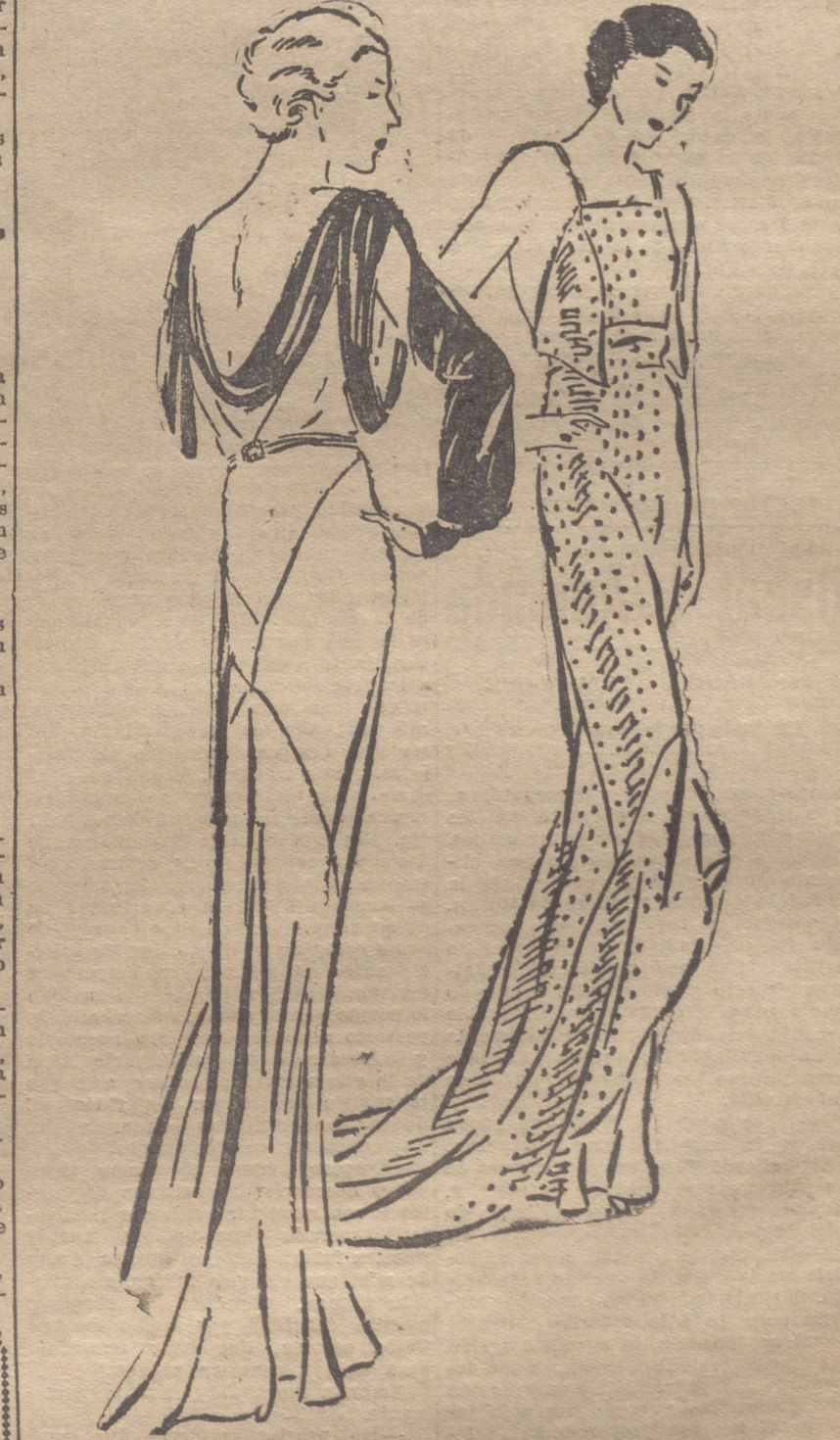
Vestido de satín blanco, con mangas postizas de satín índigo. — Vestido y noche, de lamé azul con lunares plata.