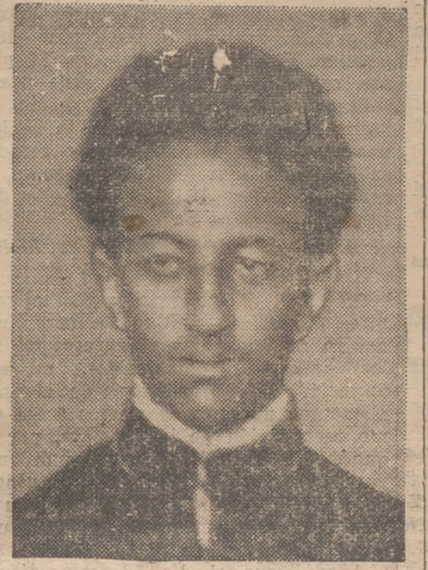
El príncipe heredero de Abissinia, Asfaa Wossen, jefe de las tropas etíopes en el norte del país