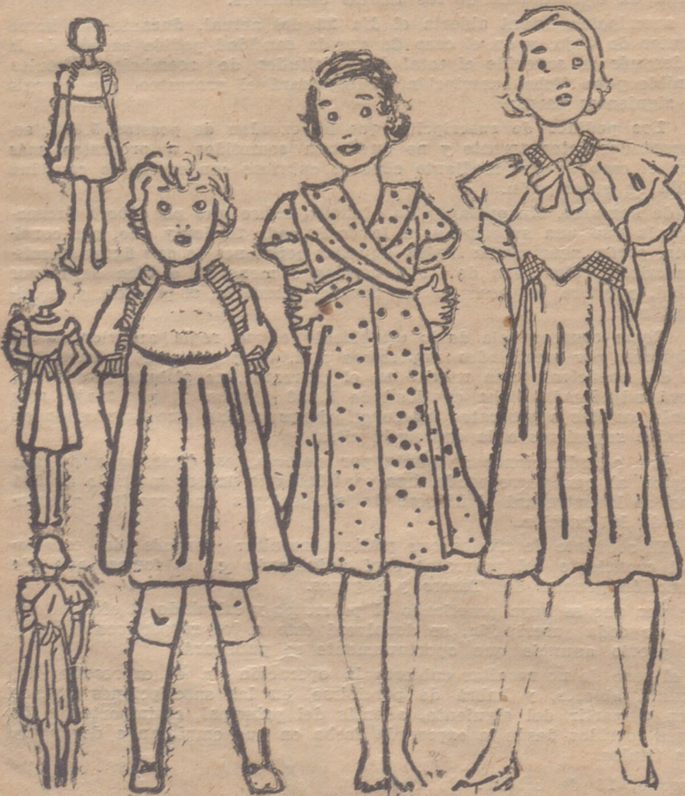
Andos modelitos para venitas de 6 a 11 años

En cambio, y contrastando con la sencillez de la línea general, se observa una gran profusión en los adornos de bordados, pasamanería y agremaciones. Y ello no solamente en los