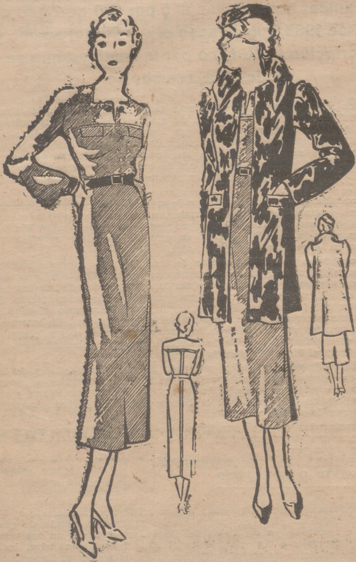
Conjunto cuyo vestido es de lana marrón. Escote cuadrado. Mangas ranfán. Botones dorados. Cinturón y puños de piel dorados. El abrigo es de nutria marrón "moaré"

ALTA COSTURA Modas ANDRES Próximamente, exhibición de MODELOS , creación de los más afamados modistos parisinos. DUQUESA DE LA VICTORIA, 32, ENTRESUELO. — LOGROÑO