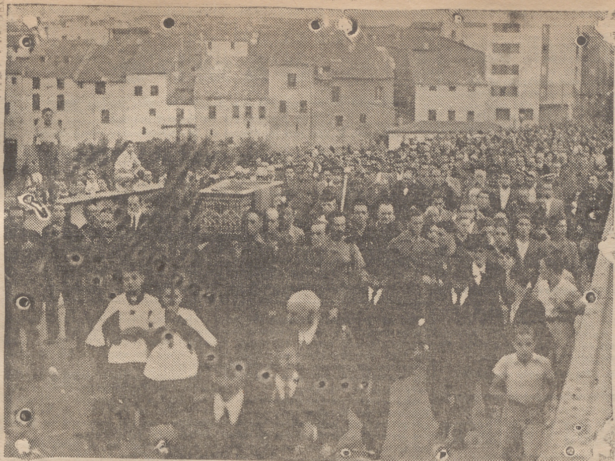
LA IMPONENTE COMITIVA FUNEBRE QUE ACOMPAÑO EL CADÁVER DEL CAPITAN JALON ALBA AL CEMENTERIO EN EL DIA DE AYER, A SU PASO POR EL PUENTE DE HIERRO