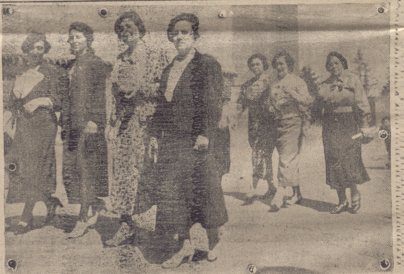
HARO. — PARA REALIZAR EL ACTO DEL BAUTIZO DE LOS DOS HERMANITOS FIGURO BUEN NUMERO DE MARGARITAS EN EL ACOMPAÑAMIENTO.