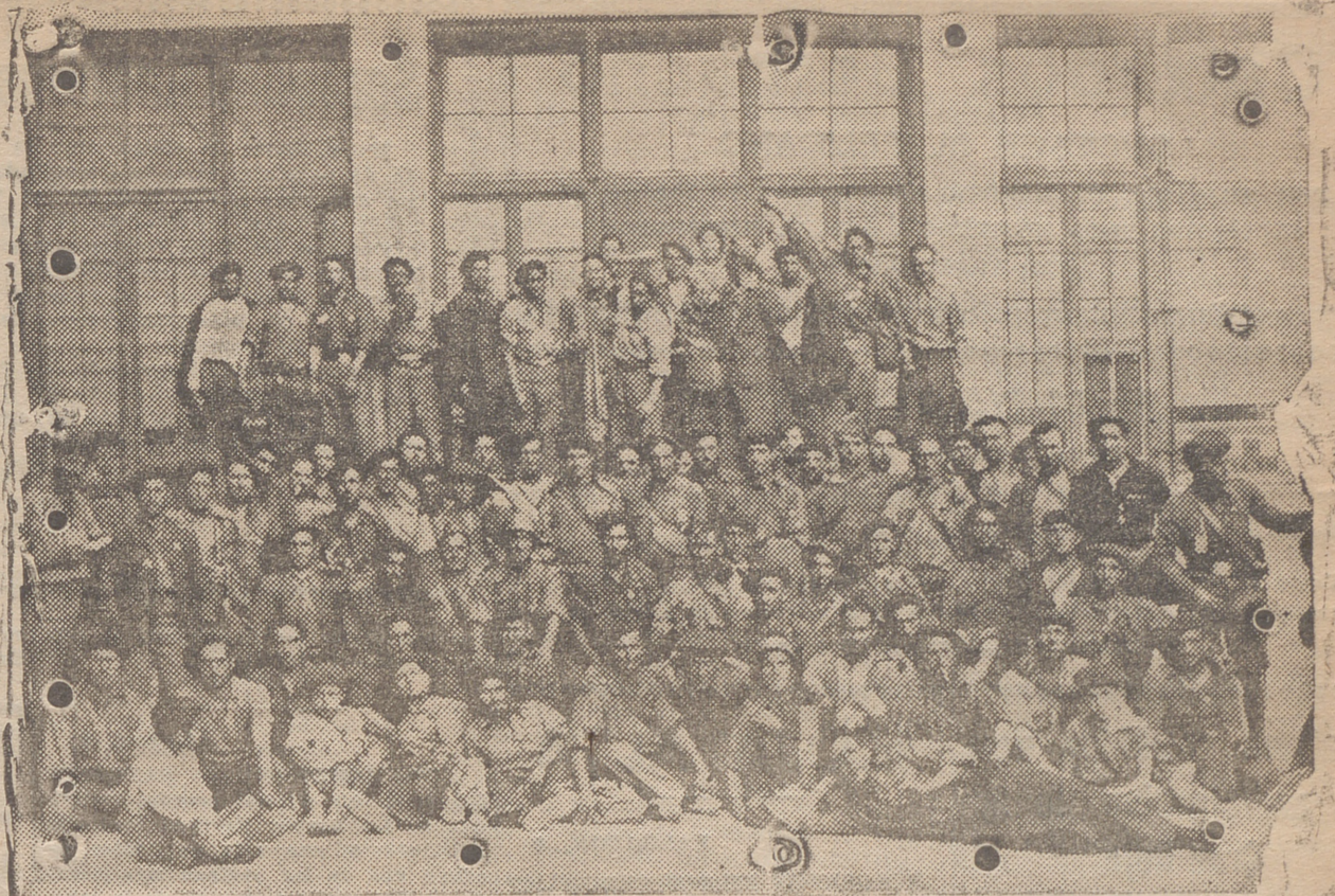
LOGROÑO. — AYER PERMANECIERON EN LOGROÑO BUEN NUMERO DE REQUETES QUE LLEGARON DEL FRENTE DE GUADARRAMA PARA SALUDAR A SUS FAMILIARES Y DESCANSAR UNOS DIAS DE LAS ACTIVIDADES DE LA CAMPANA, A LA QUE VOLVERAN CON EL MAYOR ENTUSIASMO