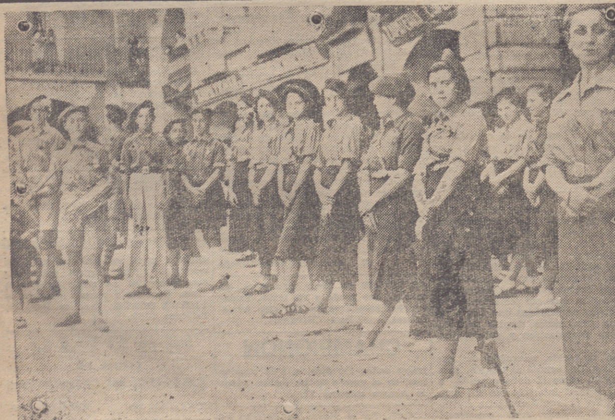
HARO. — EL REQUETE TAMBIEN FORMO EN LA COMITIVA DEL BAUTIZO.