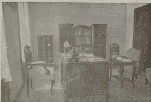
Despacho de Secretaría (180)

Entrada a la Cámara Secretaría de Economía