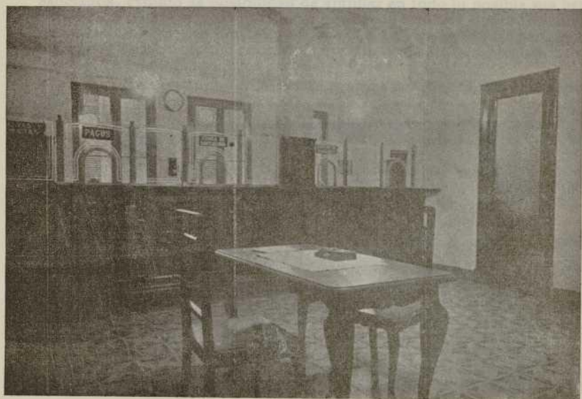
Oficinas (Hall para el público)