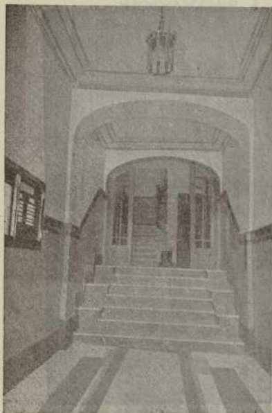
Entrada a la Cámara