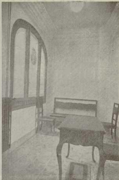
Antedespacho de Secretaría