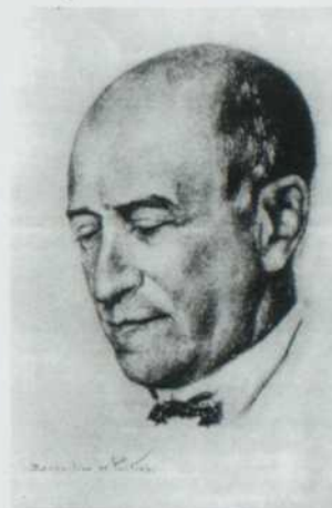
MANUEL DE FALLA

- A Manuel le conocí en París en 1913. Nos lo presentó Turina. Vivía el pobre Falla en la más pura indigencia. ¡Qué gran hombre! Siempre prefirió el hambre a la claudi-