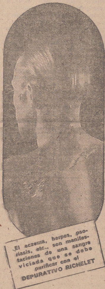
El eczema, herpes, psoriasis, etc., son manifestaciones de una sangre viciada que se debe purificar con el DEPURATIVO RICHELET