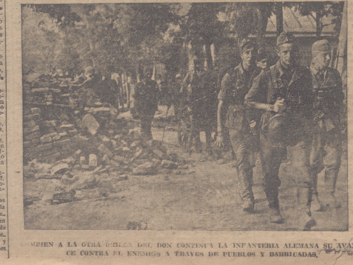
MIRAN A LA GRAN GRILLA DEL DON CONTINUA LA INFANTERIA ALEMANA SU AVANCE CONTRA EL ENEMIGO A TRAVES DE PUEBLOS Y BARRICADAS.