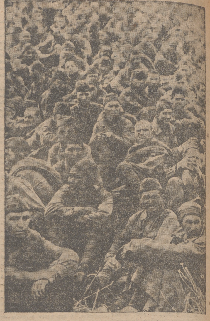
En las grandes batallas desarrolladas al norte del Cáucaso, han sido capturados grandes contingentes de prisioneros soviéticos. Ha aquí algunos de ellos que esperan ser transportados a los campos de la retaguardia alemana donde permanecerán como meros espectadores de la contienda.