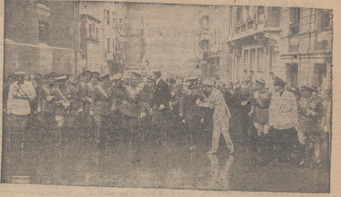
ENTRE CONSTANTES ACLAMACIONES DE LA MULTITUD, EL CAUDILLO CRUZA LAS CALLES DE LA CIUDAD ATESTADAS DE PUBLICO.