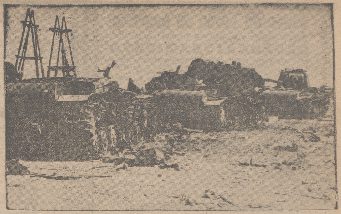
Estos tanques que ahora quedan totalmente destruidos, trataron de romper el frente alemán de Leningrado. Pero con este ataque de los soviéticos solamente se aumentó el número de sus tanques derrotados.