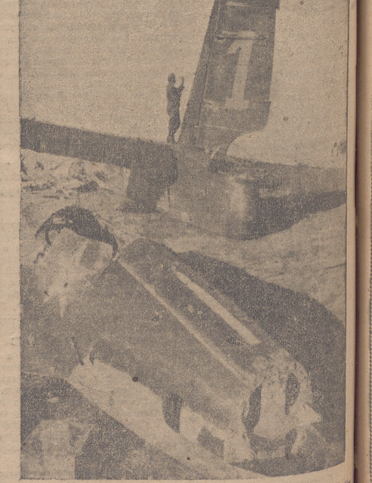
Siempre de nuevo los Stukas alemanes atacan los aeródromos aliados para derrotar los aparatos de relevo. Nuestra fotografía muestra un ataque de los Stukas alemanes.