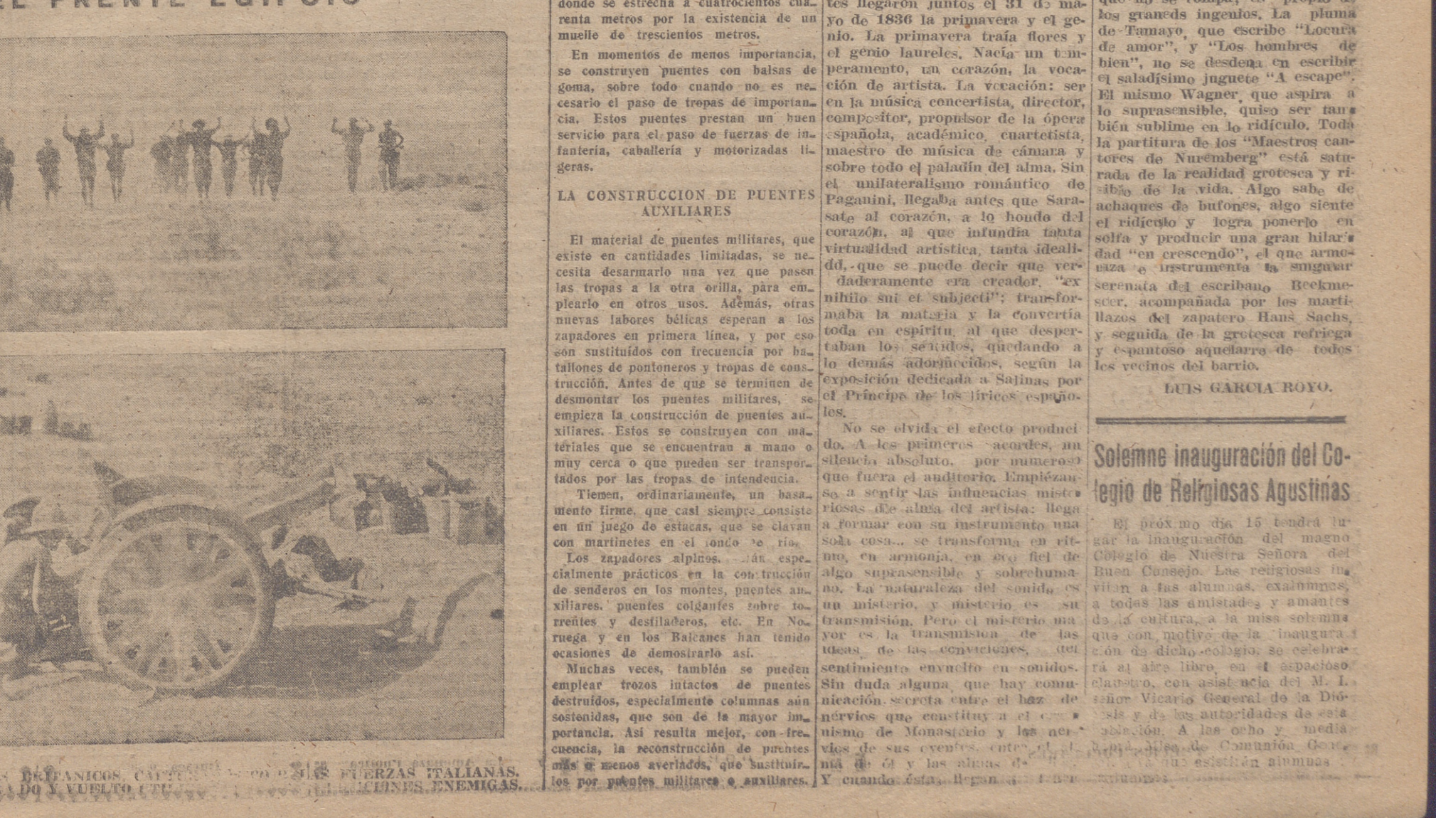
CAÑON BRITANICO... FUERZAS ITALIANAS... FUERZAS ENEMIGAS