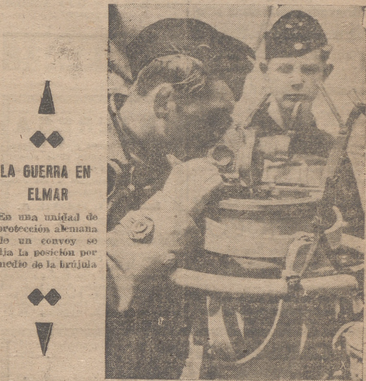
LA GUERRA EN ELMAR

Las oficinas de la Delegación provincial, estarán abiertas, por la mañana, y de 4 a 7 de la tarde.