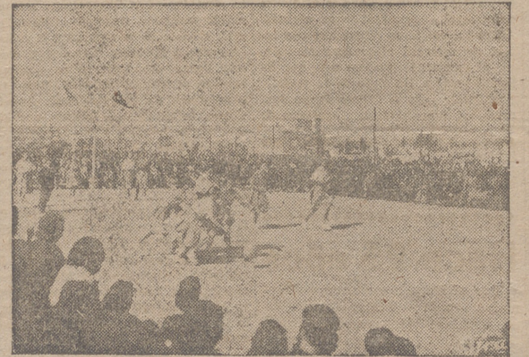
Un aspecto de la final del campeonato de baloncesto disputada en Madrid entre los equipos madrileño y donostiarra, en octubre del año 1939

—A preparar nuevamente los Campamentos de Verano, que tan beneficiosa influencia vienen ejerciendo en nuestra juventud fem-