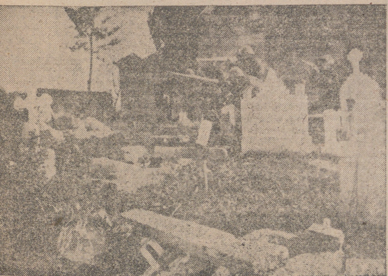
Milicianos rojos se adiestran en el manejo del fusil sobre las tumbas de un cementerio.

reflexión, el organismo en el que no ha sido necesario rectificar nada, porque todo estaba concebido perfectamente en el preámbulo y articulado del decreto, histórico en los anales de la ciencia española.