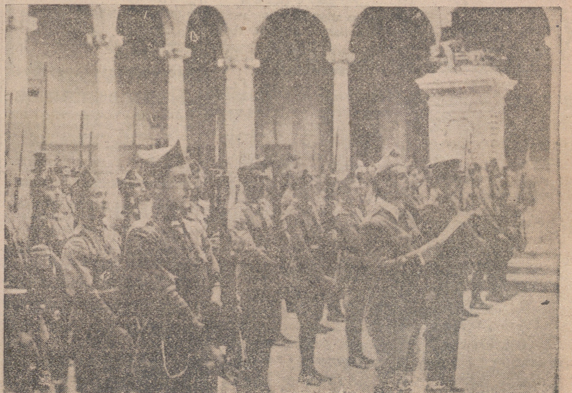
CARROS DE COMBATE EN EL DEPARTAMENTO DEL EJERCITO DE LA VICTORIA.