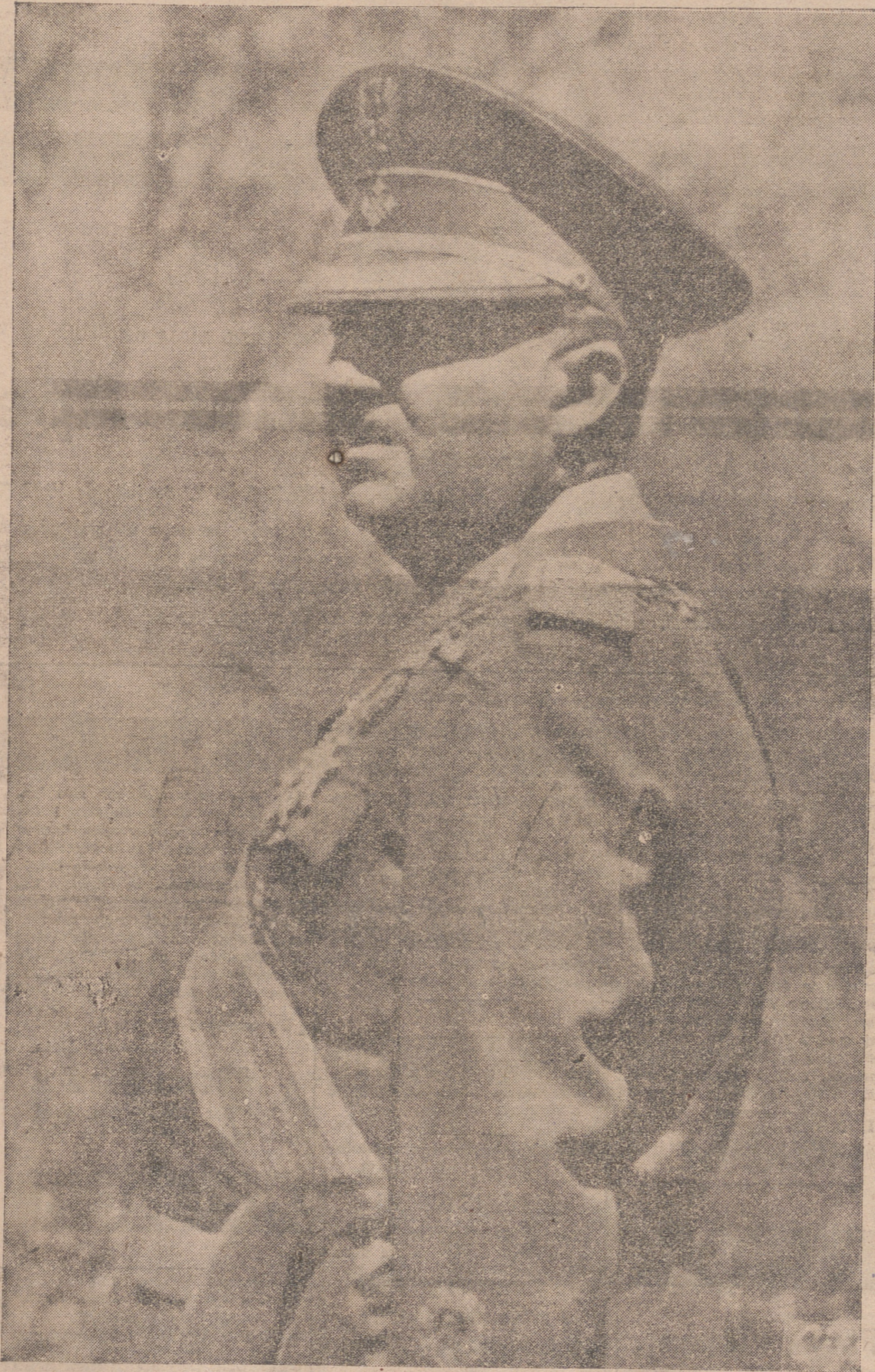
S. E. EL JEFE DEL ESTADO, GENERALISIMO FRANCO.

En el banco azul tomaron asiento los ministros por el siguiente orden: Asuntos Exteriores, Conde