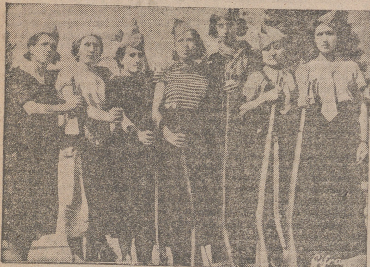
MILICIANAS ROJAS EN BARCELONA.