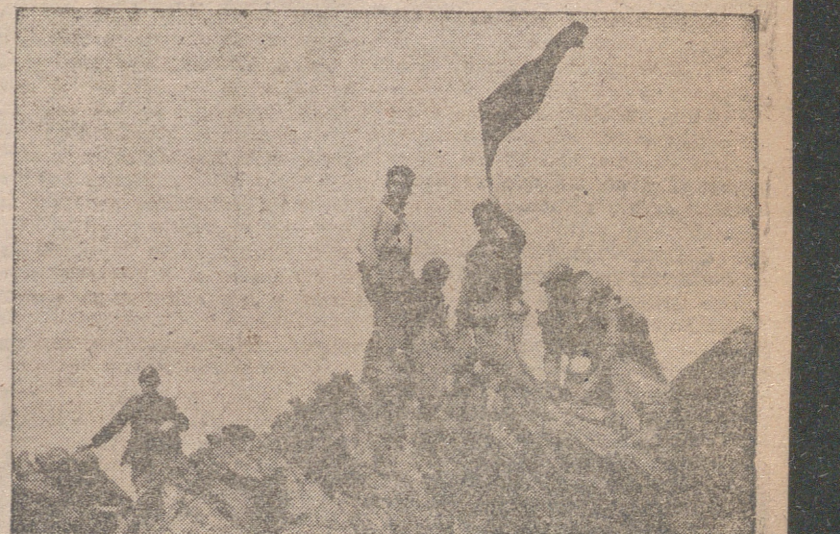
Los soldados de Franco colocan la Bandera Nacional en la frontera franco-española, al ser liberada Cataluña.