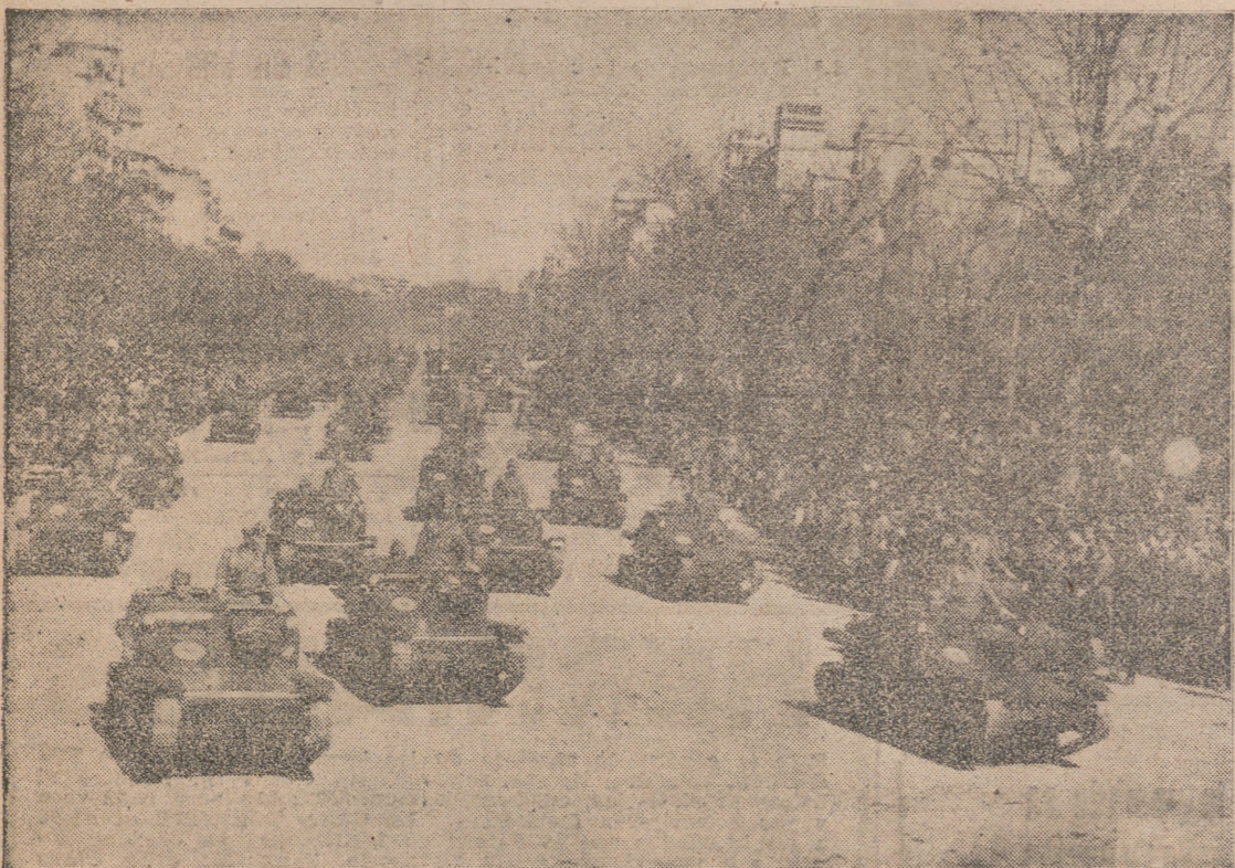
UNA FOTOGRAFIA HISTORICA.—EL CAPITAN VELA LEE EN EL PATIO DEL ALCAZAR DE TOLEDO EL BANDO DECLARANDO EL ESTADO DE GUERRA AL INICIARSE EL ALZAMIENTO.