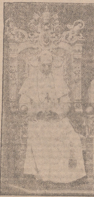
Roma, a la que tantas personas vienen del mundo entero para aprender no sólo la fe, sino la sabiduría antigua y que consideran esa ciudad como un faro de civilización fundado en virtudes cristianas.

Roma, cuyas subterráneas fueron en la época de las mayores persecuciones los primeros refugios del pueblo cristiano y de los mártires, que hicieron sagrados los anfiteatros y los circos y cuyos sepulcros, cunas del cristianismo, son todavía lugares de oración; Roma, cuyo territorio está lleno de edificios de la curia romana y de numerosos institutos y obras pontificias, de institutos internacionales y colegios que dependen de Nos, de innumerables santuarios, sin contar nuestras magníficas basílicas, patriarcales, de bibliotecas y obras de los mayores genios de las Bellas Artes;