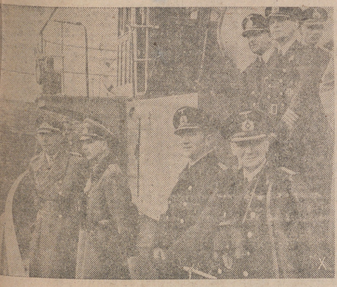
Wahlisch presencian las pruebas de protección de la entrada de un radiante una barrera de aceite incendiado.

No hay sociedad que pueda vivir y progresar sin estar sujeta a disciplina y a normas morales, y al correr de los siglos no conocido otras más perfectas, a la par que universalmente válidas, que las que dimanan de nuestra doctrina católica.