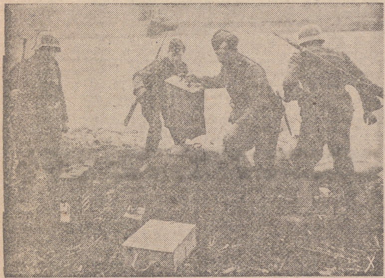
En botes neumáticos se transportan víveres y municiones que, una vez en la orilla opuesta del río son desembarcados rápidamente.