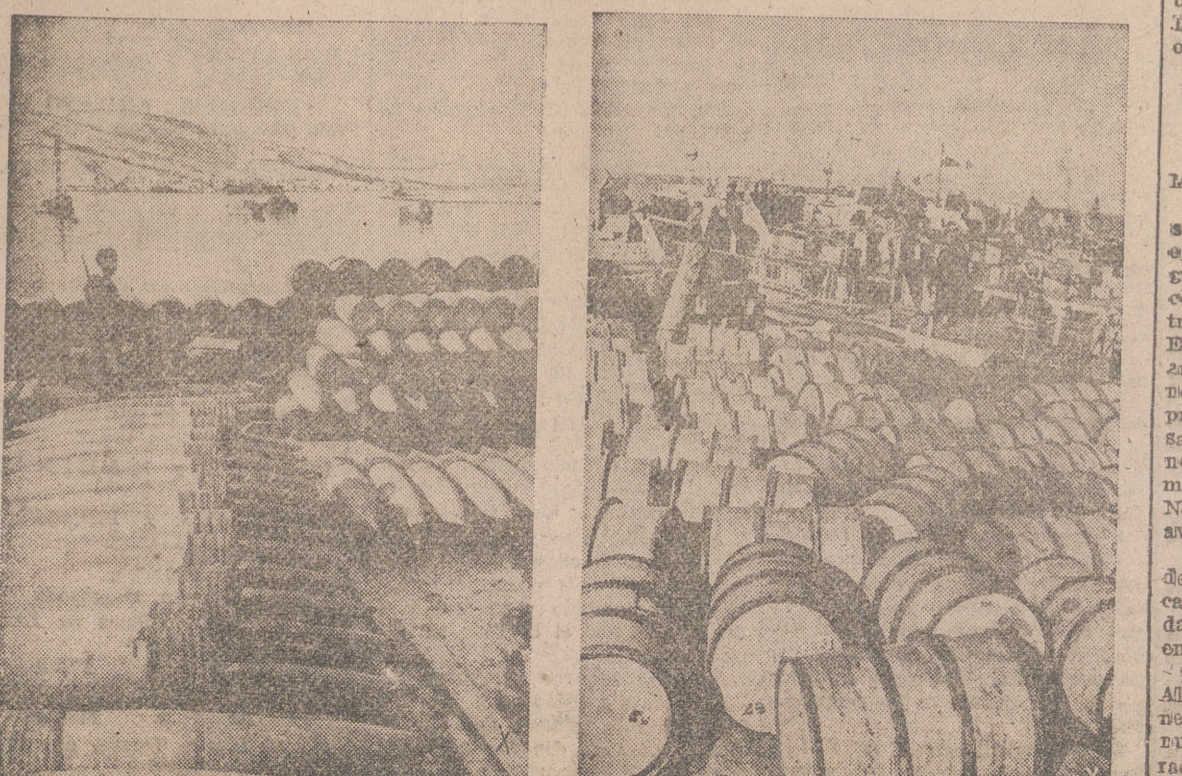
En cantidades gigantescas, las municiones de guerra y los bidones de carburante se amontonan en los puntos de embarque para su distribución.