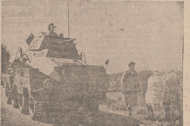
UNO DE LOS MAS RECIENTES MODELOS DE TANQUE ALEMÁN DE EXPLORACION.

«Los españoles, con su fino instinto, se sienten gobernados y encuentran en nuestro régimen la más alta expresión de la justicia tanto en el orden de los factores morales cuanto en el de los económicos».