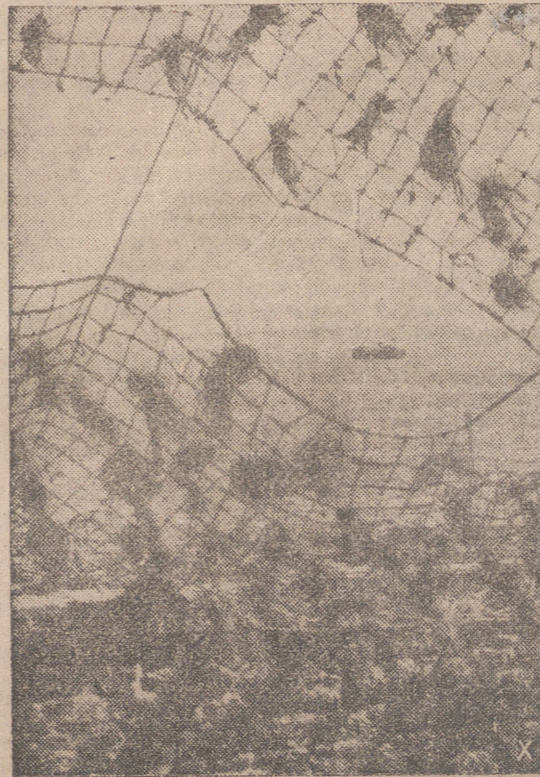
A través de la red que enmascara a una batería de costa se ve, en el mar, una pequeña unidad de la flota alemana de vigilancia. En alta mar, un submarino del Reich ha torpedeado un mercante enemigo, que desaparece bajo las aguas.