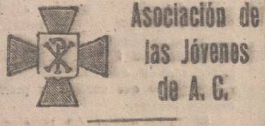
Asociación de los Jóvenes de A. C.