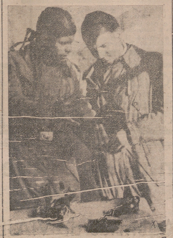
Este piloto alemán que en el curso de un combate entró en colisión con un avión soviético, salvándose gracias a su pericia, muestra las partes arrancadas al aparato enemigo en el cheque.