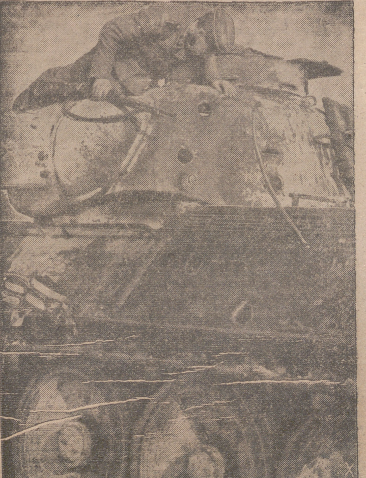
Sobre este tanque soviético T 34 pueden apreciarse claramente los impactos de las granadas anti tanques alemanas.

La 46 división de Infantería, mandada por el general Poppe, y la 23 división blindada, mandada por el general Krieger, se han distinguido notablemente en el curso de los últimos combates defensivos librados en el sector meridional del frente del Este.