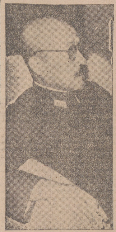
El general Tojo viste siempre un sencillo traje militar y rara vez aparece así sentado en una cómoda butaca.

Minami lo lee y pide al primer ministro una breve entrevista particular. Ambos pasan a un salón contiguo. A los pocos instantes regresan junto a sus compañeros de Gobierno.